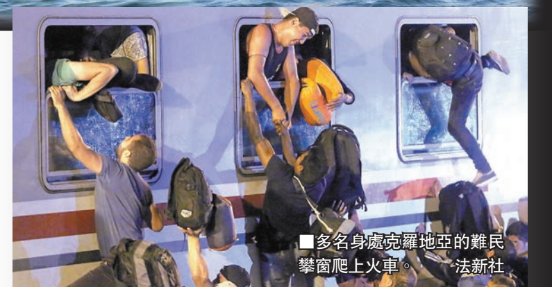
多名身處克羅地亞的難民攀窗爬上火車。