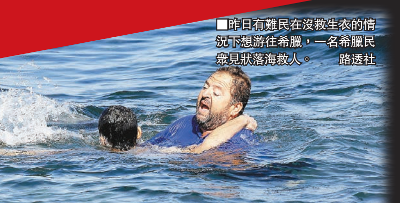
昨日有難民在沒救生衣的情況下想游往希臘，一名希臘民眾見狀落海救人。