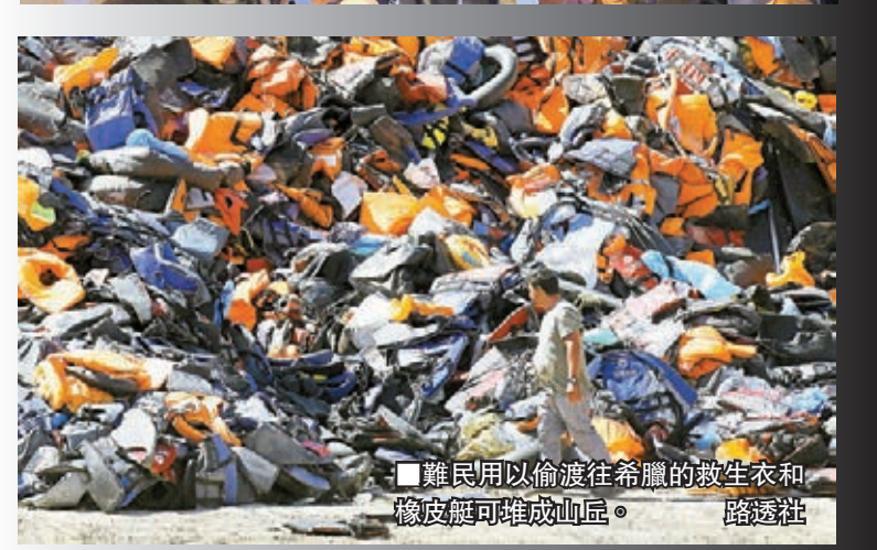
難民用以偷渡往希臘的救生衣和橡皮艇可堆成山丘。