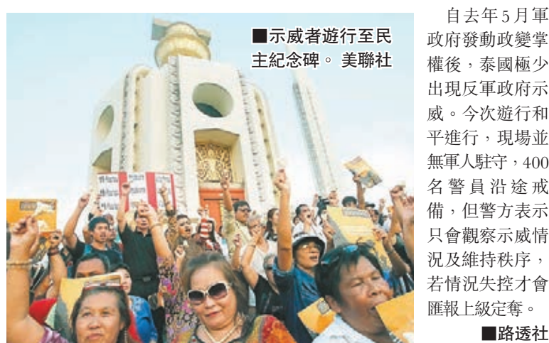
示威者遊行至民主紀念碑。

泰國數百名民眾無視軍政府禁令，昨日在首都曼谷舉行反軍政府遊行，示威者沿途高叫「不要獨裁」的口號及高舉反軍政府標語牌，遊行至民主紀念碑。約400名警員沿途戒備，但沒有阻攔。示威者昨日首先在曼谷的泰國國