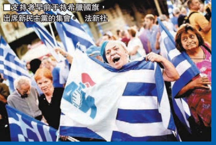
支持者早前手持希臘國旗，出席新民主黨的集會。