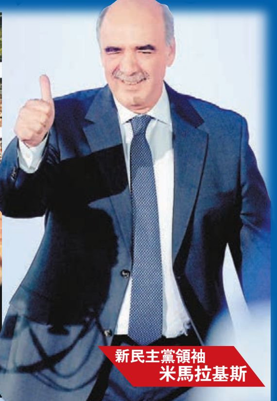
新民主黨領袖 米馬拉基斯