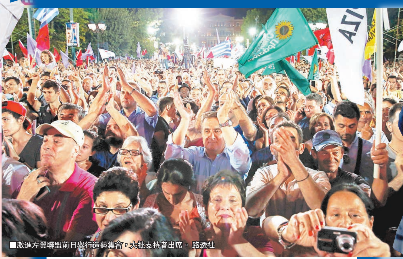
激進左翼聯盟前日舉行造勢集會，大批支持者出席。