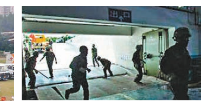
■防空演習正在進行。

香港文匯報訊（記者 帥誠 廣州報道）昨日是內地第15個全民國防教育日。廣州舉行「羊城天盾—2015」城市人民防空演習，演習首次採用無人機圖傳系統，並邀請聾人學校參加，共計約66個政府和媒體、學校單位、13,000人參加此次演習，計劃調用車輛100餘台。昨日上午11時10分預先警報響起，記者隨機採訪了幾位民眾，發現大部分人並不了解防空警報的含義，也分不清預先警報和解除警報的區別，因此未造成恐慌。據廣州市民防辦總工程師梅其岳介紹，此次演習注重實現「六個首次」，包括首次全面運用高清視頻監控系統、無人機圖傳系統對重要經濟目標進行視頻監控、首次運用防空警報互聯網報知系統同步發放防空警報信息、首次在廣州市聾人學校推廣使用人民防空警報手語，並組織緊急疏散演練等。