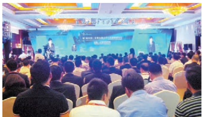
中國—東盟金融合作與發展領袖論壇在南寧召開。

前，廣西已開展9個東盟國家貨幣櫃檯掛牌交易，中國金融機構紛紛在南寧組建面向東盟的貨幣清算、結算及相關業務中心，東盟十國均與廣西開展了跨境人民幣結算業務。