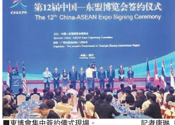
東博會集中簽約儀式現場。

2015中國—東盟電子商務峰會18日-19日在南寧舉行。來自阿里巴巴、京東、蘇寧雲商及新加坡、越南、馬來西亞等東盟國家的500多家企業參會，並圍繞「中國—東盟互聯網+新經濟」、「中國—東盟跨境電商新基地」、「中國東盟經貿信息發展」和「中國—東盟創新創業新機遇」四個議題進行探討，以推動中國與東盟在電子商務領域形成「強鏈接」，促進「一體化」的中國—東盟電子商務生態圈建立。