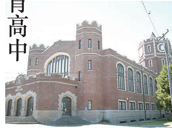
華盛頓州塔科馬市林肯高中外觀。