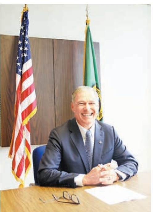
華盛頓州州長英斯利期待習近平訪美。

美國智庫彼得森國際經濟研究所高級研究員尼古拉斯·拉迪認為，中國企業來美國投資不僅帶來了就業和稅收，還可以幫助美國一些行業實現復興。