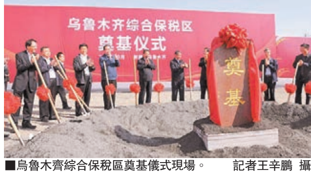
烏魯木齊綜合保稅區奠基儀式現場。

香港文匯報訊（記者 王辛鵬 烏魯木齊報道）新疆首府烏魯木齊市在推進絲綢之路經濟帶核心區「五大中心」建設上再落一子。烏魯木齊綜合保稅區昨日正式奠基，預計將於2016年7月20日之前建成並封關運營。這是繼阿拉山口和喀什之後，新疆建設的第三個綜合保稅區。至此，新疆形成了北、中、南分佈海關特殊監管區域的格局。