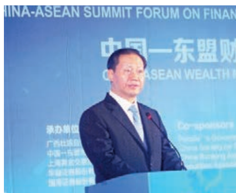
彭清華表示，廣西將加快推動沿邊金融改革。