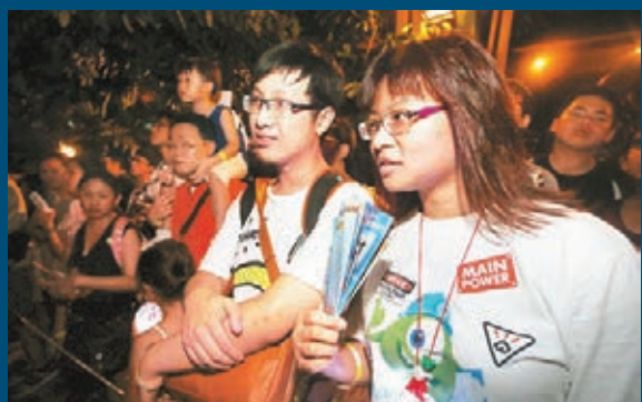
■樂園多年捧場客陳小姐稱，今年黑色世界較有氣氛，差點被「礦工」嚇到。