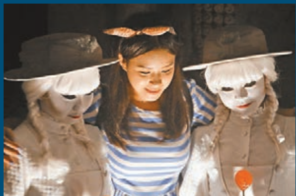
▲莊園內的白衣亡靈吸引不少遊客合照。

迪士尼黑色世界在10月2日至10月31日期間，每逢周五至周日，在晚上6時45分至11時舉行。市民可由即日起至9月30日，以優惠價港幣$349購買（原價港幣399元）「迪士尼黑色世界」夜間門票，並於指定日期及時間入場。