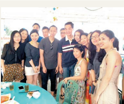
■梁振英與一眾遊客合影。