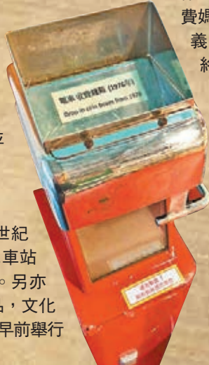
1976年的電車收費錢箱。

展館最有特色之處是一座仿照上世紀50年代電車車廂的場景,備有電車車站牌,配上藤木座椅供訪客拍照留念。另亦有1976年的電車收費錢箱。除了展品,文化館過去亦有舉辦活動予公眾參與,如早前舉行