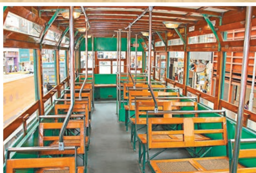
車內備有藤製的座椅、作照明用的鎢絲燈膽。