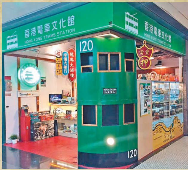
「香港電車文化館」於2013年10月在山頂廣場設立。鮑曼珊攝

展館最有特色之處是一座仿照50年代電車車廂的場景,備有電車車站牌,配上藤木座椅供訪客拍照留念。鮑曼珊攝