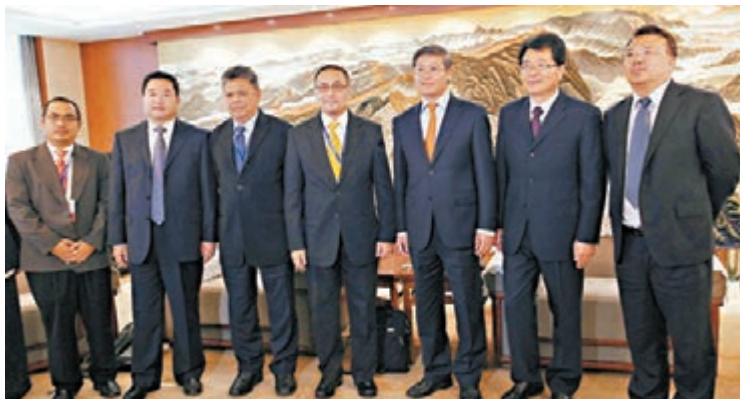
甘肅省委常委、副省長李榮燦 (右三) 會晤馬來西亞吉蘭丹州州務卿拿督騰庫·穆罕默德 (左四)。

香港文匯報訊 (記者肖剛、李燕華 臨夏報導) 馬來西亞吉蘭丹州州務卿拿督騰庫·穆罕默德日前在甘肅省臨夏州參加國際清真食品民族用品博覽會時表示，馬來西亞通過各種方式促進清真產業的發展，自2006年設立