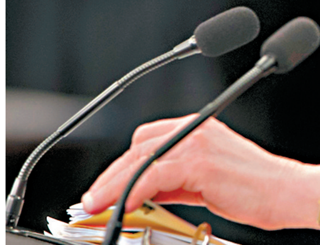
聯儲局主席耶倫表示，憂慮中國政府應付經濟下行風險的能力，令市場覺得當局看淡股市前景。

香港文匯報訊(記者 梁偉聰)美國聯儲局議息後保持利率不變，刺激一眾地產股炒上，新地(0016)及恒地(0012)各升3.8%及3.4%，長實(1113)更因富時指數成分股變動收市後生效，令基金在尾市掃貨會狂升一成，收升4.69%。而富時指數換馬亦帶動昨日港股在尾市近最後1分鐘內，成交急增150億元，令全日成交增至955億元。恒指昨收升66點，不過，晚上歐美股市急跌，港股夜期跌凸，截至昨晚10:30，報21,745點，跌339點，低水176點。