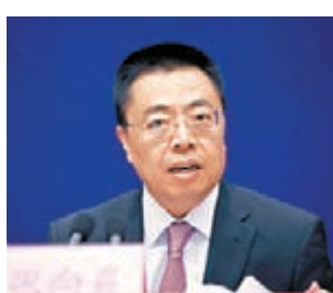
商務部國際貿易談判副代表張向晨。

香港文匯報訊(記者 孟慶舒 北京報道)國務院新聞辦公室昨日舉行新聞發佈會,商務部國際貿易談判副代表張向晨、國家統計局副局長賈楠介紹《2014年度中國對外直接投資統計公報》。張向晨指,2014年中國對外直接投資創下1,231億美元(約9,602億港元)歷史新高,連續3年位列全球第三。「走出去」的資金中,接近58%即709億美元流入香港。《公報》顯示,流入香港資金青睞租賃和商務服務、批發零售、金融、採礦、製造、房地產、交通運輸和倉儲郵政等行業。