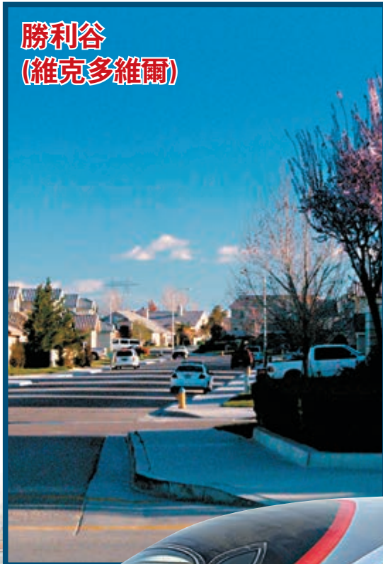
勝利谷(維克多維爾)