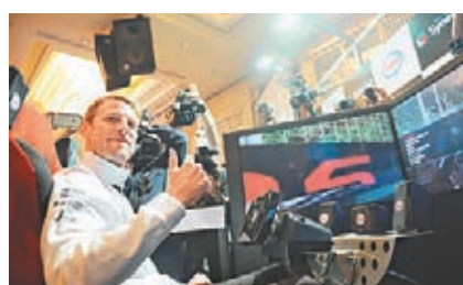
■麥拿倫車手畢頓昨日如舊出席F1宣傳活動。

新加坡近日受到印尼山火影響,全國多處煙霧瀰漫,本周將會舉行的F1街道夜戰能否如期舉行仍屬未知數,不過賽會對此表示目前沒有計劃更改比賽安排,但在聲明中發出警告: