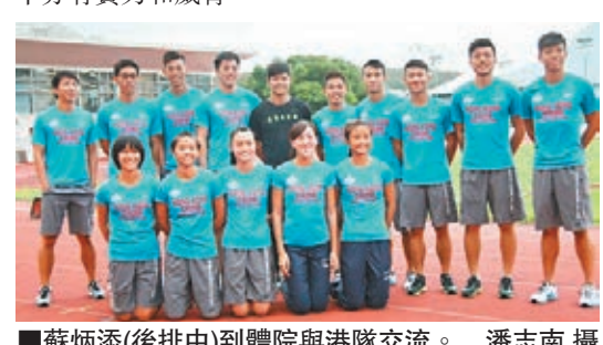
■蘇炳添(後排中)到體院與港隊交流。

對於香港4x100米接力隊,蘇炳添認為港隊成員都相當出色,因為國家隊來自全國省市,但港隊在這彈丸之地能跑出38秒47,超越了國家隊,十分有實力和威脅。