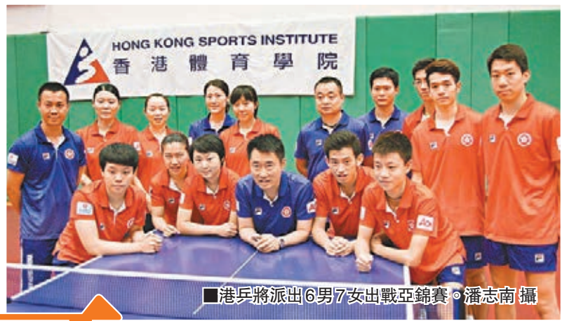
■港乒將派出6男7女出戰亞錦賽。