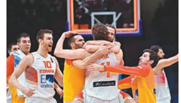
■加索(中)再成「救世主」,賽後與隊友擁慶祝。