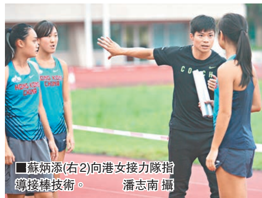
■蘇炳添(右2)向港女接力隊指導接棒技術。

香港文匯報訊(記者 潘志南)中國100米跑「男飛人」蘇炳添昨日訪問香港體院,跟香港男、女子4x100米接力隊進行交流,並把接力賽中的技巧和心得傾囊相授。蘇炳添昨日豪言下次比賽可把目前個人保持的9秒99紀錄,推前0.01秒至9秒98。