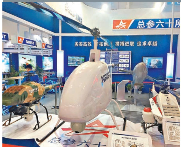
■總參六十所的多款無人機亮相北京航展。

香港文匯報訊(記者劉凝哲 北京報道)第16屆北京航展16日至19日在北京國家會議中心舉行。中航工業昨日現場發佈2015至2034年中國民用飛機市場預測,預計在未來20年間,中國需要補充各型民用客機5,522架,其中大型噴氣客機4,580架,支線客機942架。此外,本次航展上總參六十所打造的無人機亦亮相。