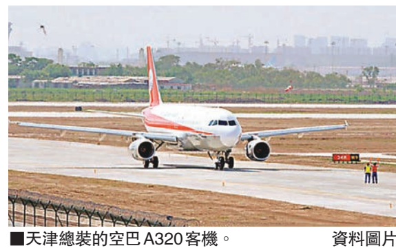
■天津總裝的空巴A320客機。資料圖片

香港文匯報訊 據中新社報道,16日舉行的第十六屆北京國際航空展上,空中巴士中國公司總裁兼首席執行官陳菊明表示,截至今年8月底,共有1,185架空中巴士飛機在內地運營,約佔內地100座級以上現役飛機總數的一半。