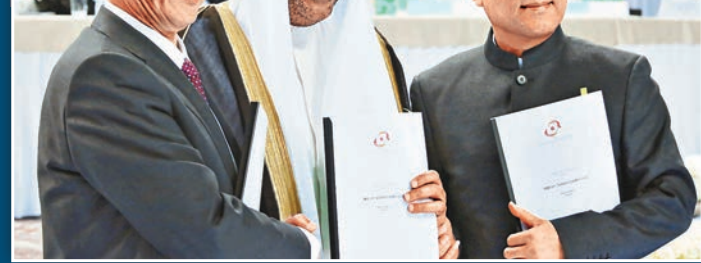
▲中國奧委會主席劉鵬、亞奧理事會主席艾哈邁德親王、杭州市市長張鴻銘(左至右)簽署主辦城市合同後合影。