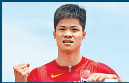
■著名田徑運動員蘇炳添。資料圖片

至於體育方面,蘇炳添在廣州亞運時亦有參賽,當時身在比賽場上,額外興奮和自豪,而運動資源的投入,也大大推動了體育設施和體育衍生出來的經濟活動。