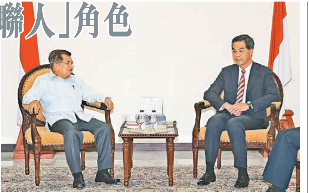
■特首與印尼副總統會面。

億港元，單是印尼已經超過400億港元，而目前內地與東盟的貿易總額中，已有約10%是通過香港進行的。他深信新設的駐雅加達經貿辦，可協助香港投資者在印尼拓展商機，促進雙邊貿易和經濟關係，並進一步加強香港作為「超級聯繫人」的功能，聯繫內地和東盟的貿易和投資交流。特區政府將繼續跟進設立新經貿辦的細節安排，以期於明年正式開設駐雅加達經貿辦。 在雅加達期間，梁振英還曾拜會東盟秘書長黎良明，及與雅加達商界領袖以及在當地工作和生活的港人會面。此外，他會與香港貿易發展局及香港旅遊發展局，一起推廣香港是「好客之都」，以及與印尼之間的貿易關係。