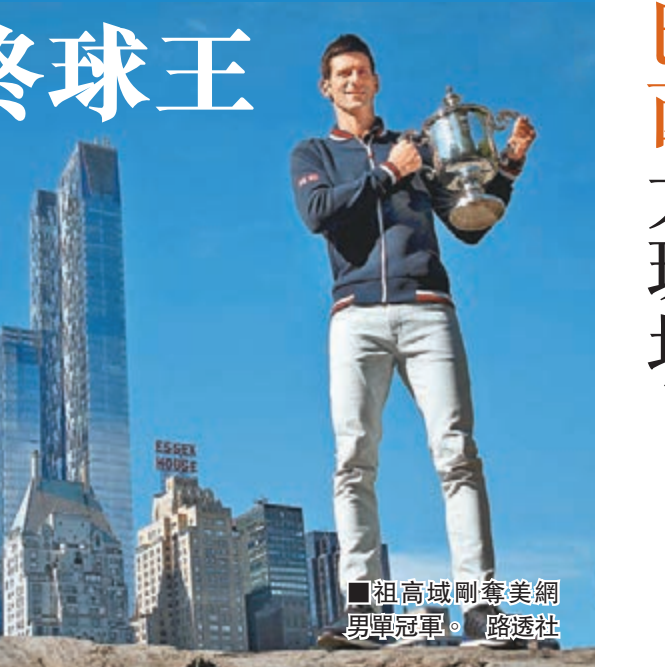
祖高域剛奪美網男單冠軍。

祖高域目前積分來到16145分,第2的費達拿是9405分,這是祖高域繼2011、2012、2014以來,生涯第4次成為年終球王。祖高域接受訪問時表示:「知道我將再次成為年終球王,感覺真是美妙,這是我從1月1日開始努力戰鬥的目標,之後到球季結束還有幾場比賽要打,我很期待接下來在北京、上海、巴黎、倫敦的賽事。得知我將成為年終球王會讓我的心情感到輕鬆,今年我已達到許多成就,希望能繼續保持這樣的良好狀態直到球季結束。」 本季至今戰績63勝5敗 祖高域本季至今戰績63勝5敗,其中對上世界前10球員的戰績是21勝4敗,2敗來自費達拿,另2次是華連卡、梅利。就賽事來看,祖高域的大滿貫戰績是恐怖的27勝1敗,使他4大滿貫都打入決賽,除了法網外都拿下冠軍。 至此祖高域職網生涯世界第1的周數已累積到164周,這在1973年採用電腦排名的歷史上排第6,才剛過費達拿的302周一半。 香港文匯報記者 梁啟剛