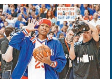
NBA傳奇球星「戰神」艾佛遜。

「AI」(艾佛遜)生涯雖然沒有拿過總冠軍,但他是NBA史上最矮小的得分王,生涯平均得分26.7分,還有6.2次助攻,獲得4次聯盟得分王、11度入選明星賽等榮譽。