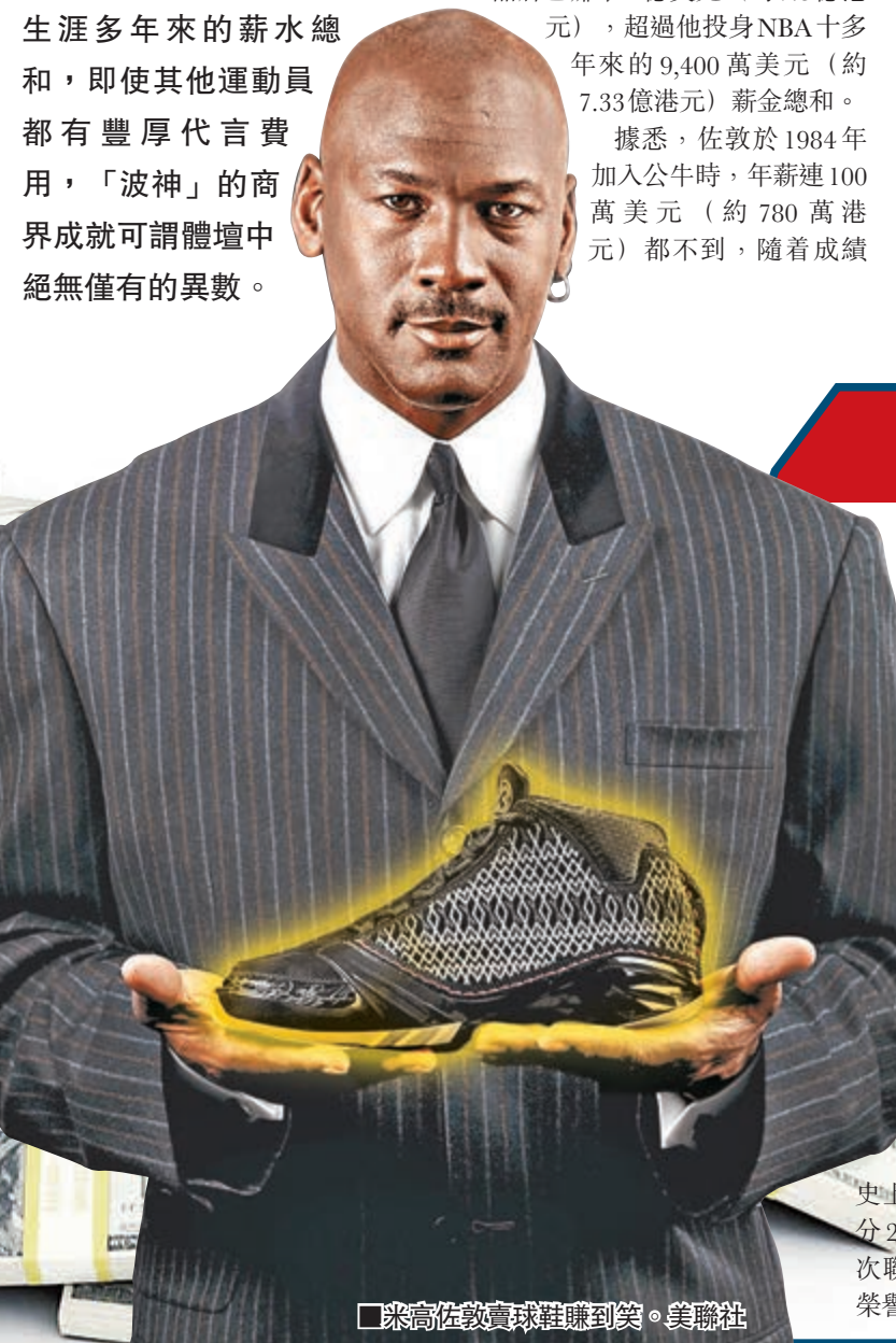
米高佐敦賣球鞋賺到笑。美聯社

體壇巨星如梅威瑟可靠雙拳打出個未來致富,但已退役常以文裝示人的「波神」米高佐敦(佐敦)就更輕鬆,因只要不時推出品牌戰靴,即能讓支持者爭相購買,增長其財富總值。昨日有報道指,佐敦單在2014年的售賣波鞋收益,已超越其職業生涯多年來的薪水總和,即使其他運動員都有豐厚代言費用,「波神」的商界成就可謂體壇中絕無僅有的異數。