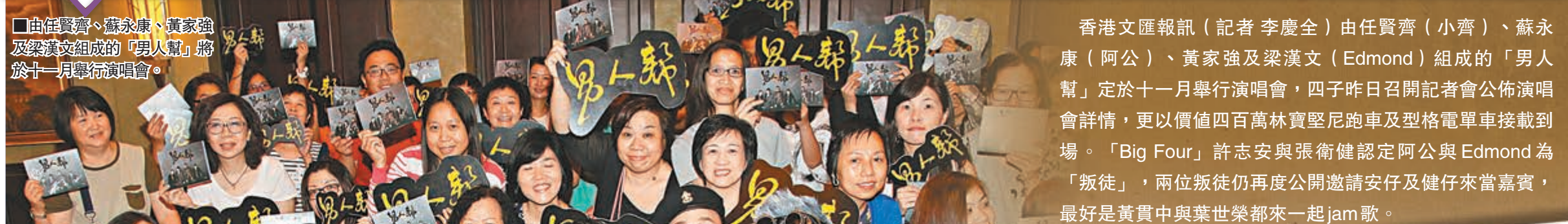
由任賢齊、蘇永康、黃家強及梁漢文組成的「男人幫」將於十一月舉行演唱會。