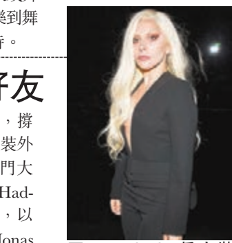
■Lady GaGa真空裝現身。