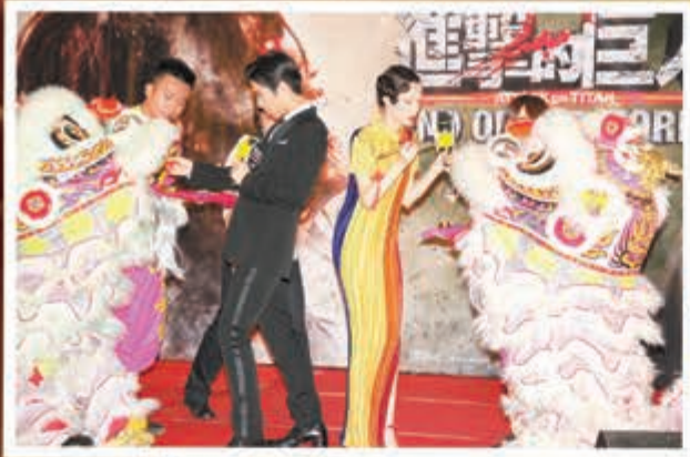
■三浦和水原幫醒獅點睛。

香港文匯報訊（記者 梁達豐）將於本週六在港上映的日本新片《進擊的巨人2：End of the World》兩位主角三浦春馬及水原希子昨晚現身apm商場，出席電影全球首映禮，吸引近千人圍觀。兩人表現親民，不時揮手，水原更大派飛吻。三浦在現場嗶廣東話及普通話，更搞笑以普通話說緊張到想去洗手間，但他一時忘記洗手間怎樣講，要在場粉絲教路提水。