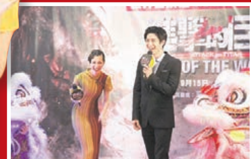
■二人聽粉絲提水後大笑。