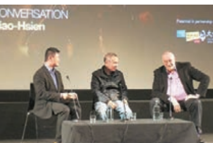
■侯孝賢（中）現身倫敦出席座談會。