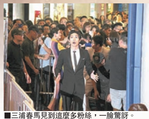
■三浦春馬見到這麼多粉絲，一臉驚訝。