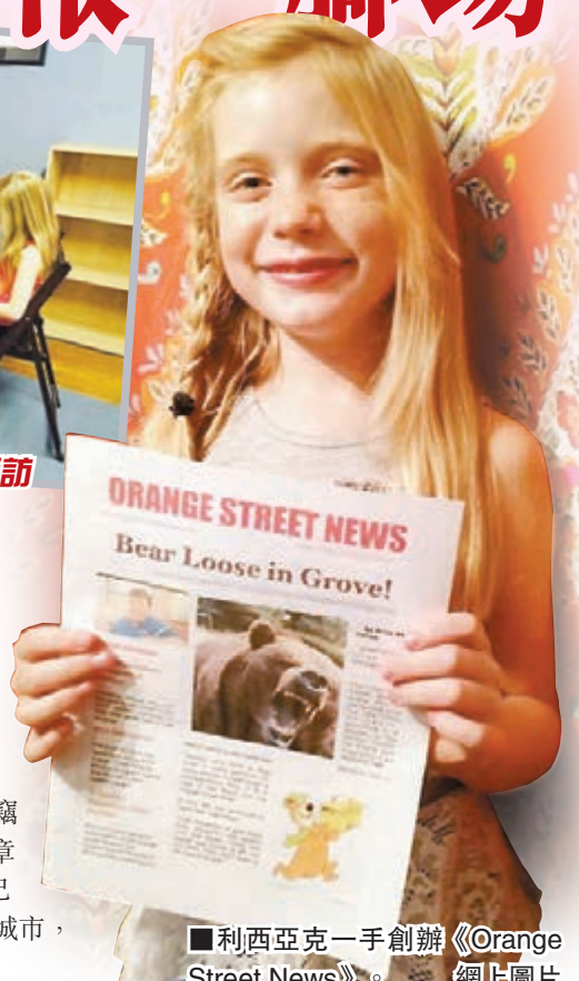
利亞克一手創辦《Orange Street News》。