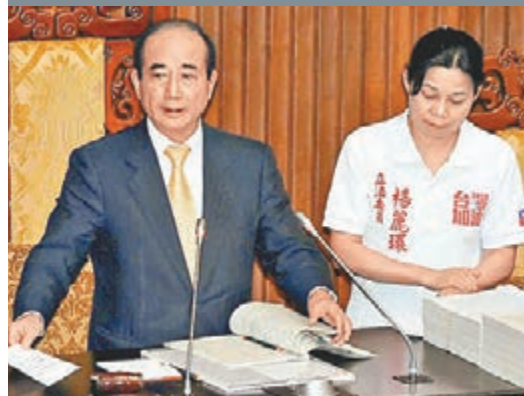
「立法院」新會期昨日開議，「立法院長」王金平(左)召集朝野協商後宣布開會並主持議事。

香港文匯報訊 據中社社報道，台「立法院」新會期昨日開議，「立法院」副院長、中國國民黨2016「總統參選人」洪秀柱所提的證券交易所稅法試閱圖，朝野皆下達動員令備戰，成為關注焦點。台灣「財政部長」張盛和表示，現行法案是「先求有再求好」，若能將爭議快速落幕，有助於股市發展。國民黨團首席副書記長林德福說，將力拼所得稅修正草案在18日(周五)通過。