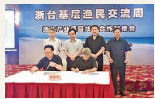
浙台漁業產業項目合作對接會現場。

香港文匯報訊 (記者 高施倩 浙江報道) 浙江和台灣的遠洋漁業、水產養殖等企業或協會、漁會代表日前簽署了4個合作意向或協議，雙方將逐步在海水養殖、遠洋捕撈、休閒觀光漁業等行業和領域開展開發與合作。