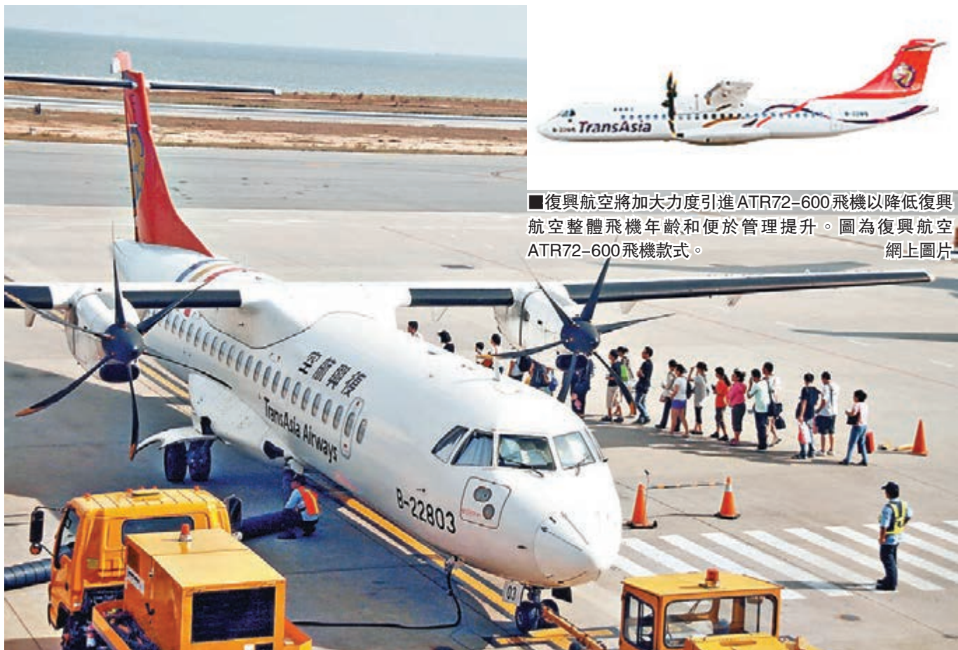
幸得航管人員發現及時，復興航空ATR72-500飛機侵入軌道才無釀禍。圖為復興航空同機型。

4日入侵跑道的復興飛機除了4名機組員外，只載了3名旅客，正副駕駛都是資深機師。而因復興疏忽造成重飛的立榮航空，機上有82名旅客。由於正副駕駛未能精確執行塔台指令，讓飛機提前進入跑道，復興航空第一時間將兩位駕駛員處以停飛並向「民航局」主動通報，而完成內部程序後，將嚴懲2名駕駛。展現「飛安缺失零容忍」的決心。而「民航局」說，復興駕駛違規造成跑道入侵事件，將依民航法罰鍰2名駕駛，預計10月初懲處。依民航法規定，兩位將停止