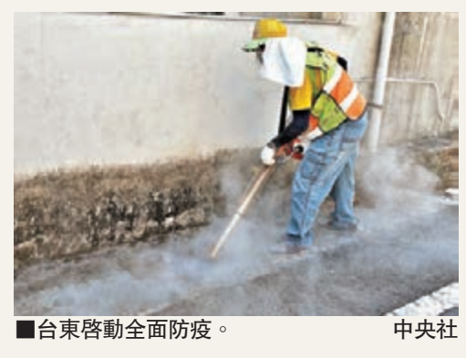
台東啟動全面防疫。

香港文匯報訊 據中央社報道，台「疾管署」昨日公佈的最新統計顯示，自5月入夏以來，全台登革熱確診病例累計9,862宗，逼近萬例。其中，台東首例登革熱前晚確診，經調查，該名患者在台南感染，但「衛生署」官網表示，台東1個案，則全台縣市均有人感染登革熱。