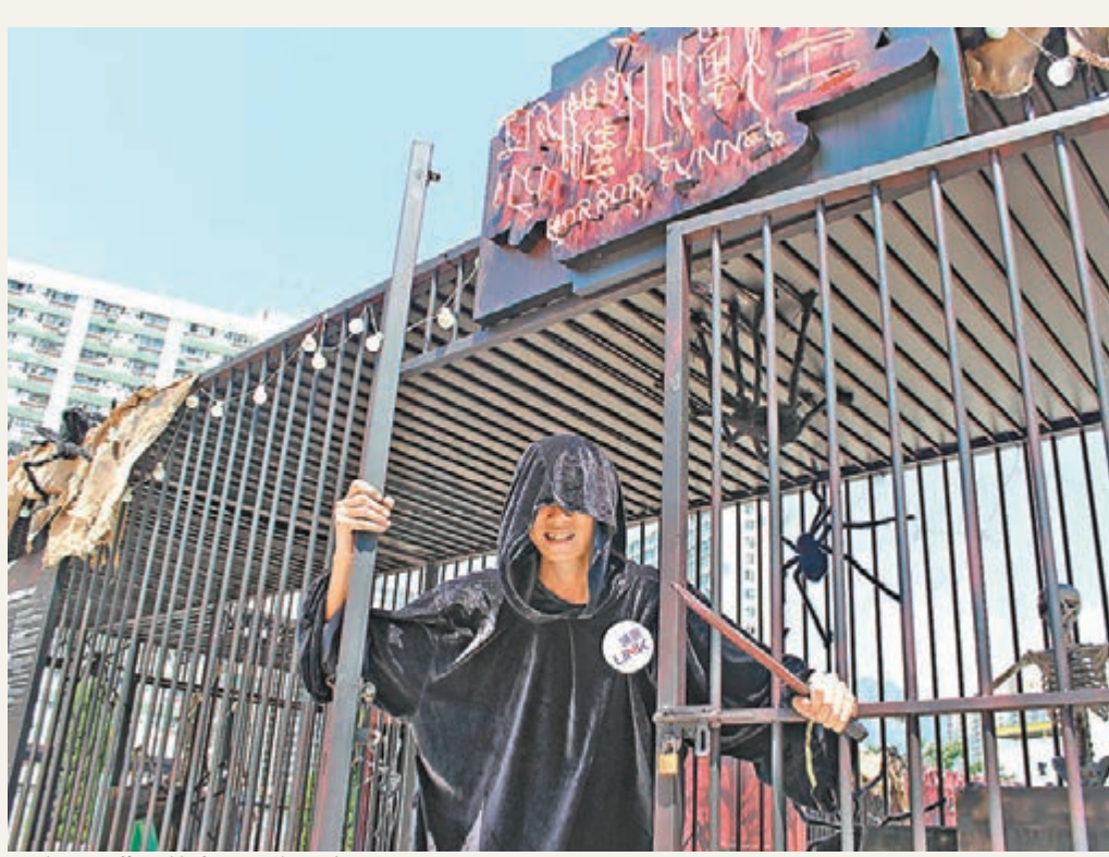
為迎接萬聖節來臨,樂富廣場推出「恐懼心戰室」,挑戰人類五大感官。

顧問又指,為增強訪客在樞紐之間的可達性,可引進水上的士、纜車、索道、單車徑及環島觀光巴士等。顧問的下一步工作將就有關康樂及旅遊發展建議,篩選具效益的短、中、長期建議方案,並為項目進行初步可行性研究,包括財務上的可行性及概括技術評估,並就可能帶來的負面影響提出有效可行的緩解措施建議。