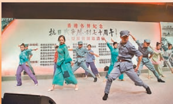
■解放軍駐香港部隊表演舞蹈《地火》