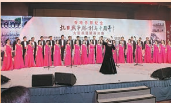
■中銀香港合唱團獻唱《保衛黃河》