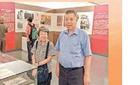
■名作家小思（盧瑋鑾教授）參觀展覽，並熱心協助展覽推廣。