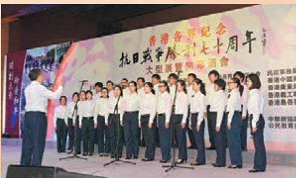
■工會青年義工合唱隊演唱