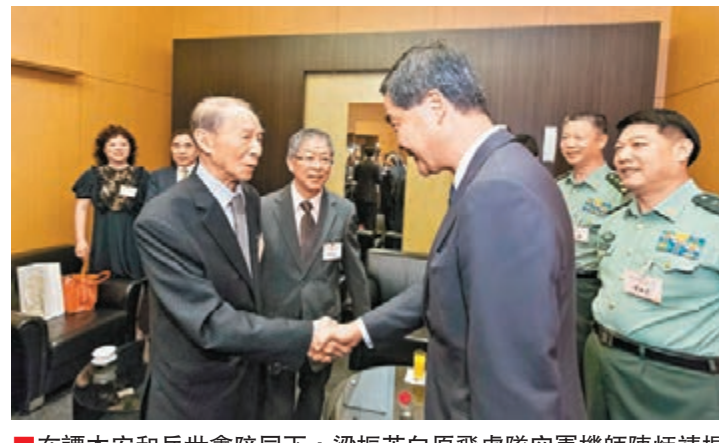
參觀展覽嘉賓感言

展覽開幕酒會於8月26日在香港會議展覽中心隆重舉行。梁振英、張曉明、譚本宏、岳世鑫、佟曉玲、楊健、曾憲梓，以及籌委會執行主席戴德豐、楊釗，主席團主席譚錦球等共同主禮，全港各大社團領袖、政商界知名人士及當年抗日老戰士等逾千人出席。 酒會由籌委會總監劉宇新宣佈開幕及領唱國歌。戴德豐致辭時表示，歷史是最好的教科書，以史為鑑，通過深入認識日本侵華歷史，有助市民特別是年輕人從中汲取深刻教訓和得到啟示。 梁振英致辭指，他深刻不忘中學老師講述侵吞當年淪為日軍馬賊的事跡。我們尤其是年輕一代，應該深入認識國家和香港曾經承受的苦難。總結中國過去百多年的歷史，我們知道落後和推打關係，知道和平並非是必然的，知道國家力量的重要，更應該知道香港和國家、香港市民和全國人民有着共同的命運。 楊釗代表籌委會致辭感謝各位領導在繁忙的公務中抽空蒞臨主禮，感謝各主辦機構、榮譽贊助人、支持機構和媒體及各方支持。最後由譚錦球致祝酒辭。開幕儀式後，中國人民解放軍駐香港部隊獻上抗戰題材的舞蹈表演《地火》和故事表演《一個人的戰鬥》；工會青年義工合唱隊演唱了《到敵人後方去》、《長城謠》；中銀香港合唱團演唱《保衛黃河》和《天路》，向抗戰英雄致敬。 開幕酒會名人雲集，出席嘉賓包括：全國人大常委柳斌杰，廣東省政協副主席溫蘭子，民政事務局長劉江華，教育局局長吳克儉，勞工及福利局局長張建宗，保安局局長黎棟國，發展局局長陳茂波，公務員事務局局長張雲正，中聯辦宣傳文體部部長朱文，協調部部長沈沖，台灣事務部部長唐怡源，青年工作部部長陳林，港島工作部部長吳仰偉，社會工作部部長楊茂等。 展覽開幕酒會於8月26日在香港會議展覽中心隆重舉行。梁振英、張曉明、譚本宏、岳世鑫、佟曉玲、楊健、曾憲梓，以及籌委會執行主席戴德豐、楊釗，主席團主席譚錦球等共同主禮，全港各大社團領袖、政商界知名人士及當年抗日老戰士等逾千人出席。 酒會由籌委會總監劉宇新宣佈開幕及領唱國歌。戴德豐致辭時表示，歷史是最好的教科書，以史為鑑，通過深入認識日本侵華歷史，有助市民特別是年輕人從中汲取深刻教訓和得到啟示。 梁振英致辭指，他深刻不忘中學老師講述侵吞當年淪為日軍馬賊的事跡。我們尤其是年輕一代，應該深入認識國家和香港曾經承受的苦難。總結中國過去百多年的歷史，我們知道落後和推打關係，知道和平並非是必然的，知道國家力量的重要，更應該知道香港和國家、香港市民和全國人民有着共同的命運。 楊釗代表籌委會致辭感謝各位領導在繁忙的公務中抽空蒞臨主禮，感謝各主辦機構、榮譽贊助人、支持機構和媒體及各方支持。最後由譚錦球致祝酒辭。開幕儀式後，中國人民解放軍駐香港部隊獻上抗戰題材的舞蹈表演《地火》和故事表演《一個人的戰鬥》；工會青年義工合唱隊演唱了《到敵人後方去》、《長城謠》；中銀香港合唱團演唱《保衛黃河》和《天路》，向抗戰英雄致敬。 開幕酒會名人雲集，出席嘉賓包括：全國人大常委柳斌杰，廣東省政協副主席溫蘭子，民政事務局長劉江華，教育局局長吳克儉，勞工及福利局局長張建宗，保安局局長黎棟國，發展局局長陳茂波，公務員事務局局長張雲正，中聯辦宣傳文體部部長朱文，協調部部長沈沖，台灣事務部部長唐怡源，青年工作部部長陳林，港島工作部部長吳仰偉，社會工作部部長楊茂等。