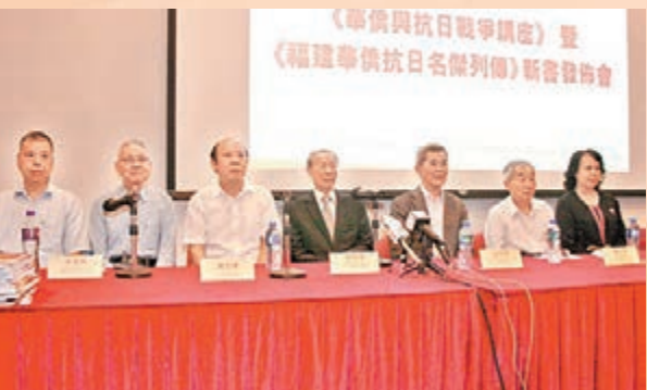
■8月25日展覽開幕當日舉行《華僑與抗日戰爭講座》和《福建華僑抗日名傑列傳》新書發佈會。