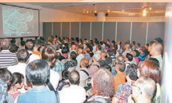
■放映區坐得密密麻麻