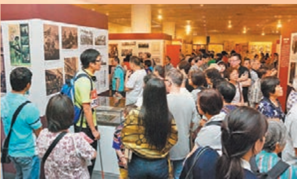
■展覽內容豐富，吸引大批市民觀看。