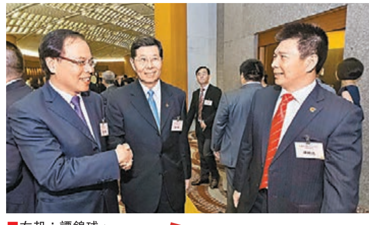
參觀展覽嘉賓感言