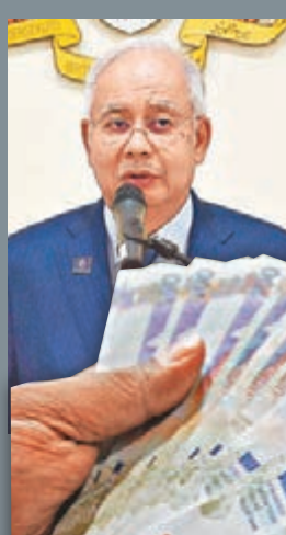
金兌美元跌至近18年低位，令納吉布出招救市。資料圖片

受經濟放緩及政治醜聞影響，馬來西亞股市今年累跌9%，本幣令吉兌美元更跌至近18年低位。大馬總理納吉布昨日宣佈連串救市措施，包括向國營投資公司 Value-Cap 注資200億令吉(約360億港元)，增加投資估值過低的公