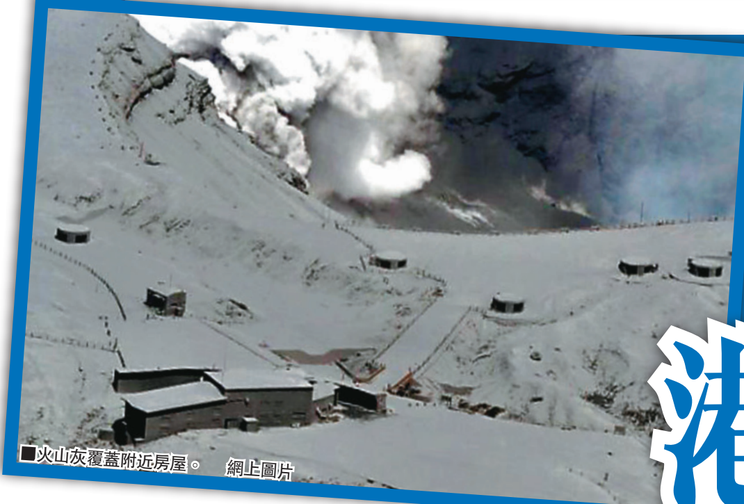
火山灰覆蓋附近房屋。網止圖片