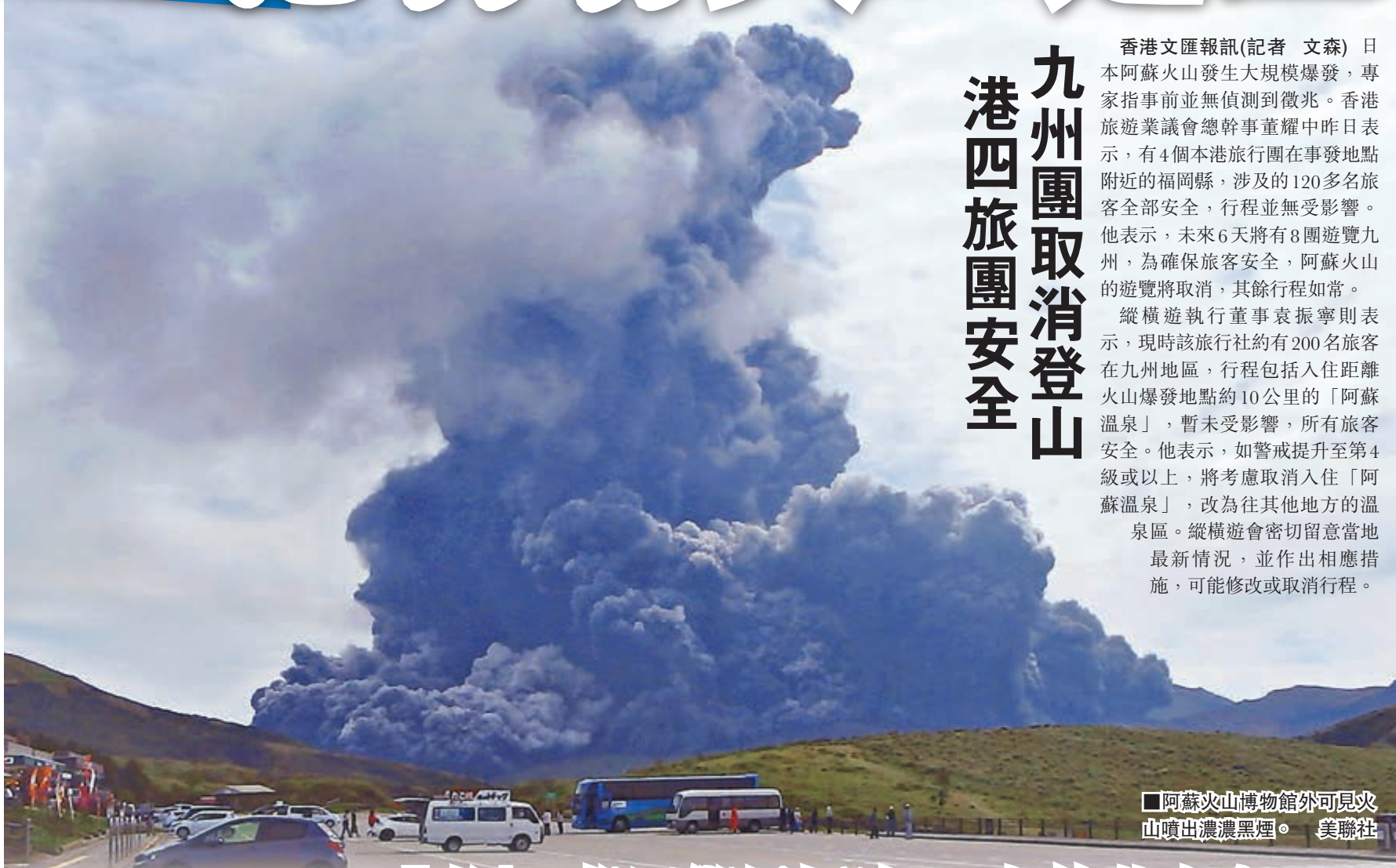
阿蘇山博物館外可見火山噴出濃濃黑煙。