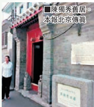
陳獨秀舊居。

位於北京東城區北池子箭桿胡同20號的陳獨秀故居，目前已修繕完成，將根據史料恢復陳獨秀舊居室內陳列，於明年「五四」前對外開放。舊居所在的東華門街道與北京新文化運動紀念館簽署協議，將合作恢復舊居原貌。陳獨秀的孫女陳紅表示，希望舊居修復和陳列尊重歷史事實，還原爺爺在北京的儉樸生活。「不要弄那種奢華的展覽，讓這裡真正發揮他的作用。」新文化運動紀念館負責人介紹，這裡還將成為東城區愛國主義一處新場所。