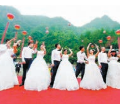
新娘向賓客拋花束。

以「情定白水洋，愛在鷺鶯溪」為主題的水上集體婚禮，近日在福建寧德屏南白水洋舉行。當天，20對來自內地不同省市新人，在「廊橋之鄉」屏南的白水洋水上廣場，舉行一場萬人矚目的水上集體婚禮。同時，第五屆寧德世界地質公園文化旅游節也在當日揭幕。