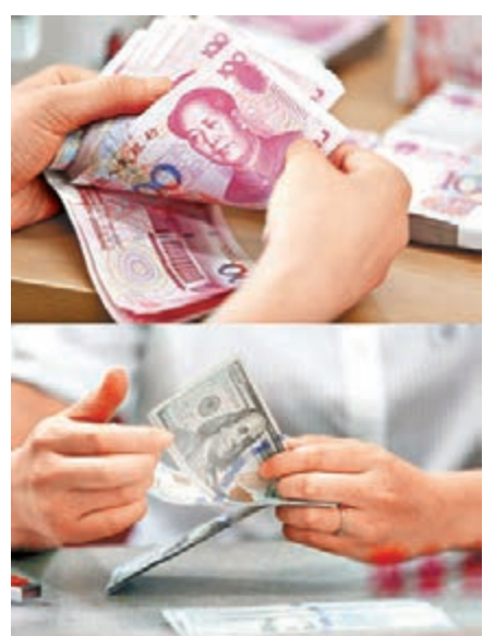
盛傳在干預下人民幣離岸價上週明顯反彈，帶動在岸價回升上1美元兌6.3750元人民幣水平。

持穩增長態勢。抗暖化題材涵蓋再生能源、水資源及環境污染控制等領域，分佈在技術、工業及公共事業等產業，後續將受惠於美國經濟回暖，綠色產業有望雨露均霑。