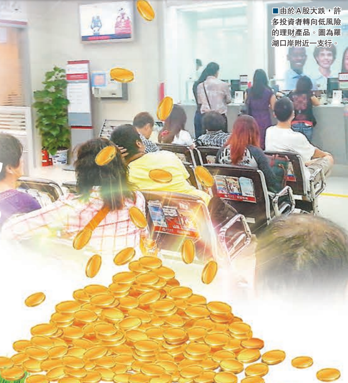
■由於A股大跌，許多投資者轉向低風險的理財產品。圖為羅湖口岸附近一支行。

經過反覆對比，她發現目前阿里金融旗下的招財寶收益還能跑贏銀行理財產品和貨幣基金的收益，截至9月10日招財寶分3款產品，分別對應6個月、12個月、24個月，而年化收益率則分別為4.28%、6.35%和6.90%。