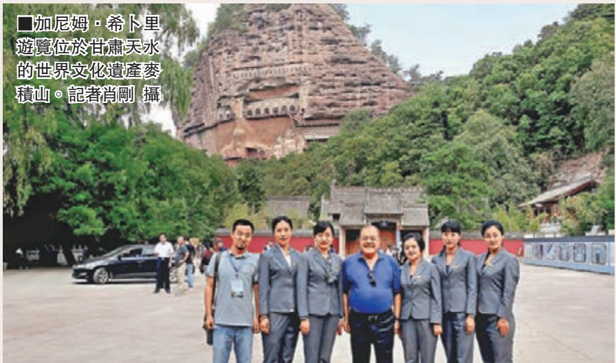
■加尼姆·希卜里遊覽位於甘肅天水的世界文化遺產麥積山。

天水市長楊維俊介紹，作為國家規劃建設的關中—天水經濟區之重點城市，天水不僅是中國歷史文化名城，也是國家級金融生態城市和循環農業示範市，與中阿交流協會共同舉辦此次活動，將促成中阿合作邁向深入，為共建絲綢之路經濟帶，以及天水與阿拉伯國家在農產品、清真食品、電子商務、勞務交流、文化旅遊等領域實現優勢互補、合作共贏，提供了重大機遇，搭建了良好平台。