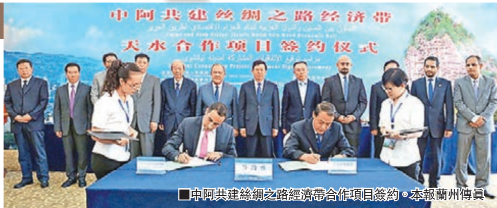
■中阿共建絲綢之路經濟帶合作項目簽約。

■阿拉伯國家聯盟駐華代表處大使加尼姆·希卜里透露，阿拉伯國家已成立了400人的工作團隊，專門投入「一帶一路」雙邊工作。