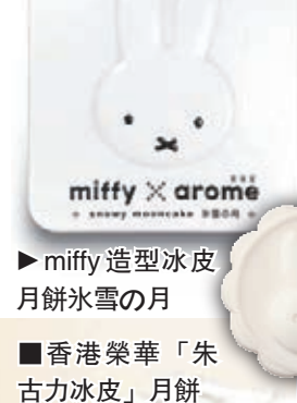
miffy造型冰皮月餅白雪的月