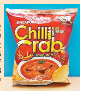
蟹季開鑼創「辛」登場

嚐不一樣的滋味。這款全新「新加坡香辣蟹味薯片」入口味道甜中帶辣，並保留蟹肉的鮮嫩海鮮味道，味道完美配合溢滿口腔，讓你安坐家中亦能品嚐異國風味，薯片狂迷萬勿錯過。薯片淨重增至65克，全由香港工場新鮮直接生產，免除空運及船運的延緩，讓你親嚐最鮮味薯片，產品已於9月上旬於各大超級市場、便利店及零售店發售。