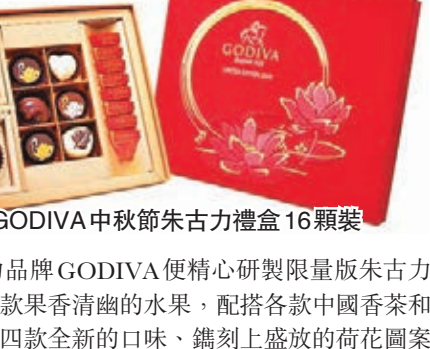
GODIVA中秋節朱古力禮盒16顆裝

近年，除了傳統月餅外，冰皮、雪糕月餅亦非常流行，原來朱古力也可以做成月餅，就如比利時朱古力品牌GODIVA便精心研製限量版朱古力月餅禮盒，今年更特選多款果香清幽的水果，配搭各款中國香茶和口感豐盈的果仁，締造出四款全新的口味，鑄刻上盛放的荷花圖案的中秋朱古力月餅。其全新口味包括佛手柑紅茶香脆牛奶朱古力、柑橘抹茶香脆黑朱古力、橘子抹茶香脆迷你牛奶朱古力及柑桔紅茶香脆迷你黑朱古力月餅。