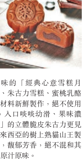
香港榮華「朱古力冰皮」月餅

另外，香港星巴克今年推出4款獨特口味的月餅，包括首度推出的海鹽焦糖麻糬朱古力及抹茶麻糬紅豆口味，海鹽焦糖朱古力餡料味道豐富，而抹茶甘濃芳香，兩者配搭香軟清甜的麻糬，交織出創新獨特的滋味口感。