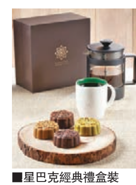
星巴克經典禮盒裝