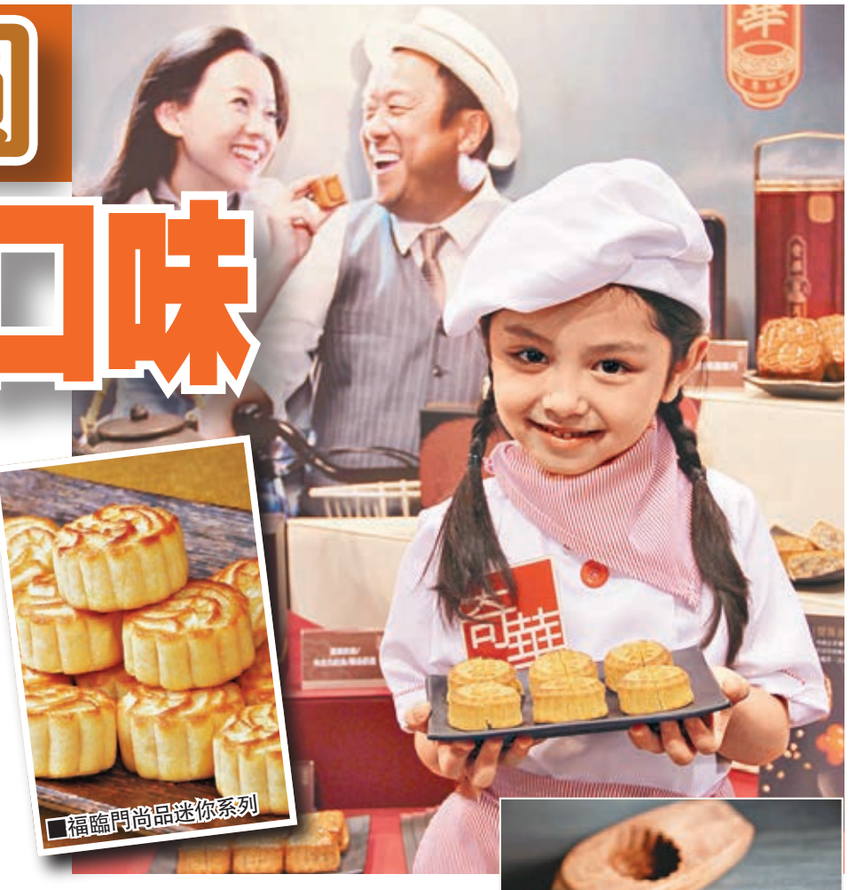
福臨門尚品迷你系列