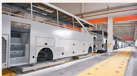
■江淮集團位於合肥市包河區的安凱新能客車基地塗裝生產線。

香港文匯報訊（記者 趙臣 合肥報道）據江淮汽車集團官網消息，安徽江淮汽車集團與武漢盟盛人新能源汽車產業園發展股份有限公司簽署合作框架協議，將在武漢市蔡甸區投資建設年產1萬輛新能源汽車項目。合資公司註冊資本為人民幣5,000萬元，江淮汽車以現金和實物出資，佔註冊資本的70%，武漢盟盛人新能源以現金出資，佔30%。該項目將於年底開工，力爭明年內形成目標產能和營銷服務能力。 根據協議，江淮汽車負責產品的開發及技術支持，主導合資公司的運營管理，確保合資公司在同質條件下，有限採購武漢當地配套零部件等；武漢盟盛人新能源負責提供土地及按照江淮汽車提供的規劃建設方案進行廠房及基礎設施建設。同時，武漢盟盛人新能源還要負責爭取當地新能源汽車政策支持，包括但不限於取得500台武漢市新能源出租車市場，1,500至2,000台電動卡車的政府採購訂單，電動客車在當地的示範運營和推廣等。 今年前7月，江淮新能源轎車累計售出3,637輛，同比增長超過500%。