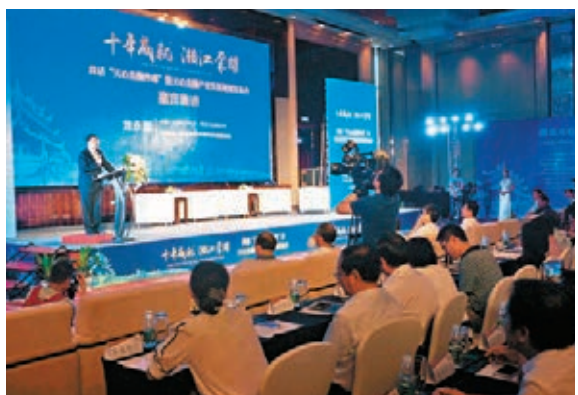
■發佈會現場，龍永圖發表主題演講。

香港文匯報訊（記者 譚錦屏 長沙報道）「共話天心金融外灘暨天心金融產業規劃編制發佈會」日前在長沙天心區舉行，天心區在會上正式發佈《天心金融產業發展規劃》。根據《規劃》，天心區將沿轄內32公里湘江岸線，致力打造與上海黃浦江外灘媲美的「天心湘江金融外灘」。