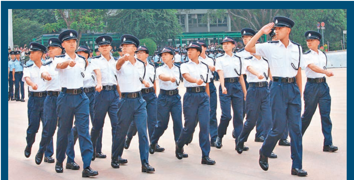
■香港警察學院舉行結業會操。