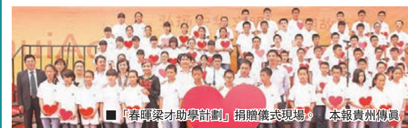
■「春暉梁才助學計劃」捐贈儀式現場。 本報貴州傳真

香港文匯報訊（記者 路麗寧 貴陽報道）貴州省春暉行動發展基金會「春暉梁才助學計劃」從今年起至2017年，將投入3,528萬元（人民幣，下同），資助240名貴州籍貧困家庭子女完成初、高中學業。