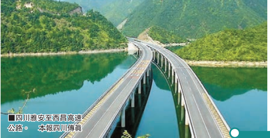
■四川雅安至西昌高速公路。 本報四川傳真

香港文匯報訊（記者 李兵 成都報道）四川省人民政府官網日前正式對外發佈，成都、川南、川東北、攀西和川西北五大經濟區2015年重點工作方案，讓省內各地發展藍圖變得更加清晰。四川將此項改革放在基礎較好的成都（都）德（陽）綿（陽）地區，進行先行先試。