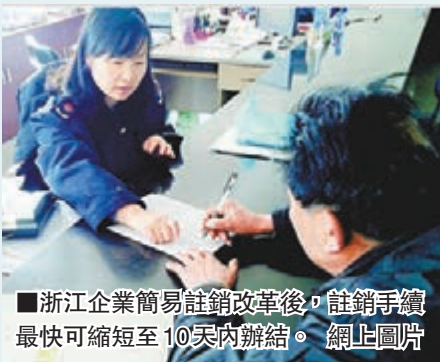
■浙江企業簡易註銷改革後，註銷手續最快可縮短至10天內辦結。

香港文匯報訊（記者 高施倩、通訊員 沈雁 浙江報道）記者昨日從浙江省工商局獲悉，浙江作為內地率先在全省範圍試點企業簡易註銷改革試點的省份，將通過省去擬註銷企業清算組備案、改變公告方式等方式簡化企業註銷登記手續，最快可在10天內辦結，從制度設計上根本解決廣大創業者「進門容易出門難」的問題。