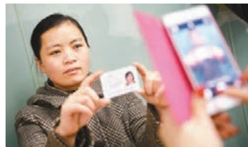
■在西安市總工會就業服務中心裡，一名學員在拍照，準備學習創建自己的網店。資料圖片

香港文匯報訊（記者 張仕珍 西安報道）陝西省政府新聞辦最近召開新聞發佈會，介紹2015年陝西高校畢業生就業創業情況。為加強創業指導，陝西省開展了創業師資培訓，今年上半年舉辦了兩期「高校創業指導師」專題培訓班，同時，依托相關機構對1,100餘名有創業意願的畢業生進行免費創業培訓。目前，近500名畢業生已在離校前實現自主創業，仍有部分畢業生正在實施自主創業準備工作，帶動2,000多人就業。