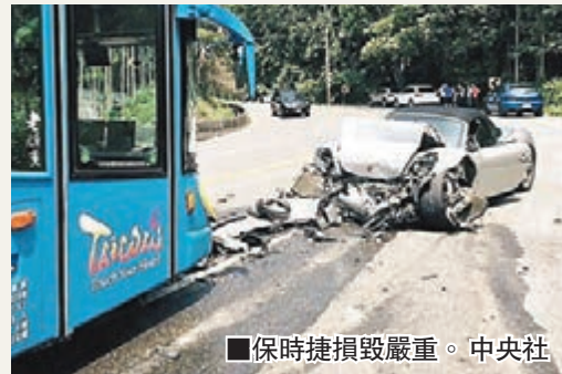
保時捷撞毀嚴重。

香港文匯報訊 據中通社報道，一輛保時捷跑車昨日在台灣南投縣魚池鄉日月潭台21線公路跨越中心線撞上一輛旅遊巴士，導致旅遊巴士上3名陸客及跑車內2名乘客受傷送醫。