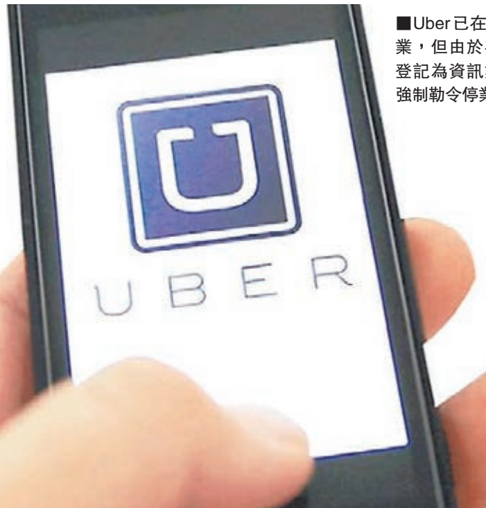
Uber已在多地被勒令停業，但由於在香港其公司登記為資訊業，因此無法強制勒令停業。

在台灣經營Uber App的台灣宇博數位服務公司自去年9月起，被「交通部」公路總局以「未經申請核准經營汽車運輸業」為由，迄今總共開出461張罰單，罰款累計高達3,759萬元。台灣宇博針對今年1