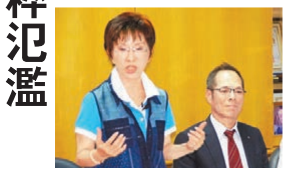
洪秀柱(左)出席講座時感慨現今民粹政治氛圍。

洪秀柱又提到認同「九二共識」是基本共識，指出是不必挑戰的事實，競選「總統」的人若連這個基本常識都不願意正面去承認、處處想迴避，不曉得心中到底在想什麼？兩岸都在例行性軍事演習，不必無限上綱，兩岸必須要有和平協議的簽定，軍事互信的基礎在，才能開創新局面。