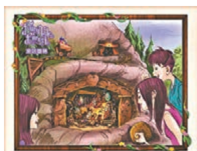
■全新「童話園林」將於今年12月推出。