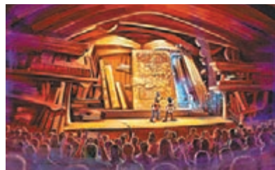
■全新舞台表演「迪士尼魔法書房」將於11月17日起推出。