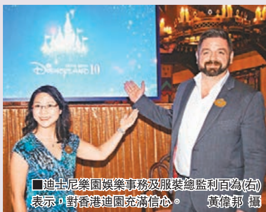
■迪士尼樂園娛樂事務及服裝總監利百為(右)表示, 對香港迪園充滿信心。

行政長官梁振英昨晚出席香港迪士尼樂園慶祝開幕10周年典禮致辭時表示, 感謝香港迪士尼對香港旅遊業的貢獻, 而樂園是特區政府的策略性投資, 提供