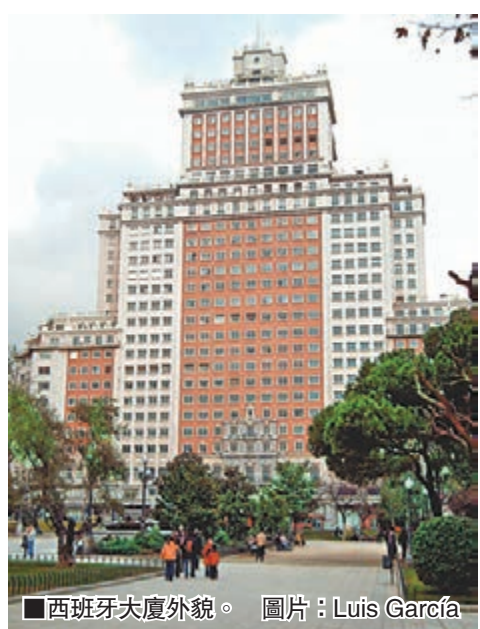
■西班牙大廈外貌。

不僅如此，在今年年底，西班牙馬上就要進行大選了。現在，離大選只剩下三個月。從目前西班牙各政黨所得到的支持率來看，執政的人民黨並不佔多大的優勢。有分析預測說，人民黨很可能在12月的大選中失勢，或是以微弱的優勢與其他政黨聯合執政。如果真是這樣，萬達集團此前與人民黨中央和地方政府所達成的意向、協議等等都將變得岌岌可危，甚至是廢紙一張。如此看來，現在西班牙的整個政治大環境都不利於萬達投資計劃的實現與展開。