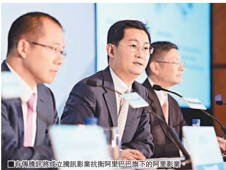
■傳騰訊將成立騰訊影業抗衡阿里巴巴旗下的阿里影業。

今年內地票房一直在穩定向上，第一季度票房收入就超過了96億元，上半年過後內地票房已經突破了200億元，接近2013年全年票房。9月5日就超過300億元，比去年同期足足多出100億元。目前，距離年底還有接近4個月，保守估計按照每個月吸金25億元來計算，2015全年票房收入也必定能夠突破400億元。