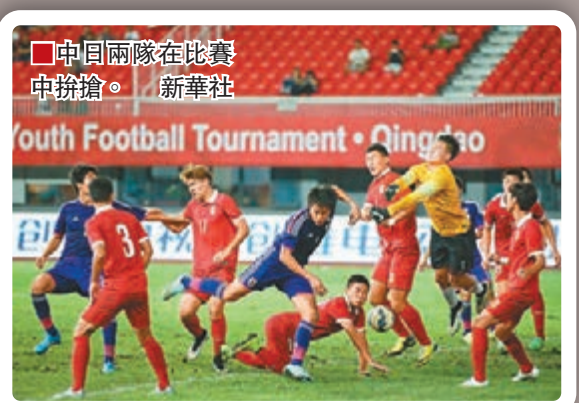
中日兩隊在比賽中拼搶。

2015年「長安福特盃」中國足球國際青年足球錦標賽前晚在青島國信體育場展開第二比賽日的爭奪。在首