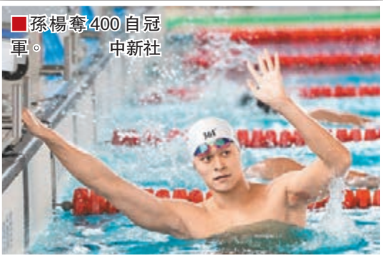
孫楊奪400自冠軍。

在安徽黃山進行的2015年全國游泳錦標賽昨晚結束了最後一日八個項目的決賽爭奪，孫楊在男子400米自由泳決賽中，以3分42秒70的出色成績獲得冠軍，比他在喀山世錦賽拿到金牌