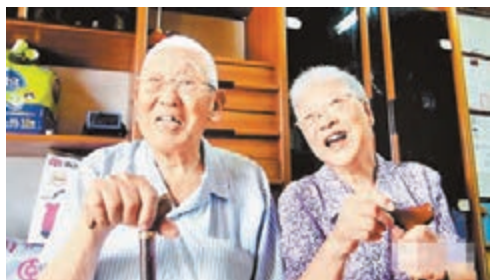
■受訪時李氏夫婦樂呵呵地細數日常生活瑣事。

一對在大陸山東生長的夫妻,當年因戰亂被迫分離,在海峽兩岸各自婚嫁,半世紀後,竟盼得彼此再牽手共度餘生。事情發生20年後,這對已近百歲的老人家成了《來得及說再見》電影的主角,影片明日將上映。