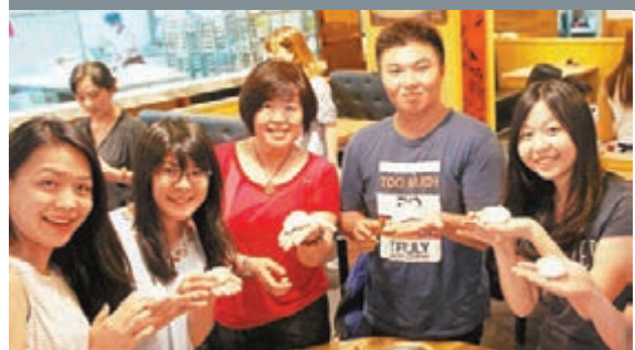
■台灣大學生若入讀私立大學4年至少需103萬生活費。中新社

香港文匯報訊 據中通社報道,台「財金智慧教育推廣協會」一項調查指出,近七成台灣大學生擔心就學期間「錢不夠用」,且自認為進入職場的起薪,頂多只有