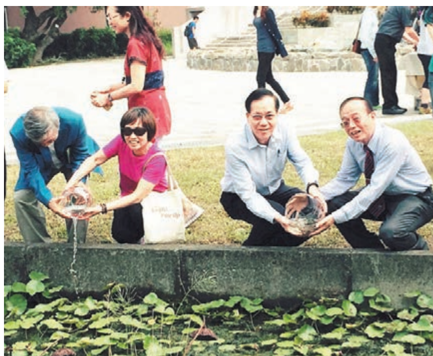
讓病人獲得該有的醫療照護。

台南市是本次登革熱疫情的重災區。據該市衛生局昨日發佈的統計顯示,全市病例數達6,576例,較前一日新增507例,再創單日新增病例數新高。「疾管署副署長」莊人祥表示,因應登革熱疫情,協助台南市推動各項防治工作,台當局行政主管部門第二預備金4,200萬元新台幣(約合港幣1,005萬元)已確定在昨日核撥。「疾管署」亦正採取措施加速病例檢驗,