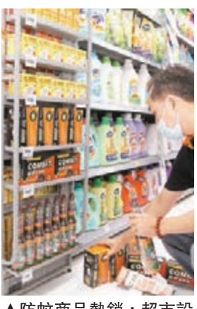
▲防蚊商品熱銷,超市設防登革熱專區搶商機。圖為員工忙著補貨。

政院」也表示本周末將進行全台灣預防性大清掃。昨早「行政院長」毛治國表示,最近不時出現豪雨,每次雨後必須即時檢視及清理積水容器,由地方政府監督相關工作。毛治國也表示,今年全球登革熱疫情比去年嚴重,依照經驗,可能要等到11月或者天氣更冷時,情況才會趨緩。