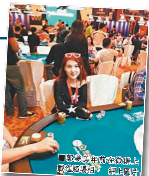
■郭美美年前在微博上載進賭場相。

謝通祥指出,開設賭場罪,是指為賭博提供場所,設定賭博方式,提供賭具、籌碼、資金等組織賭博本人從中營利的行為,實踐中開設賭場營利主要有兩種方式,其一是開設賭場但不直接參加賭博,以收取場地、用具使用費或者抽頭獲利;其二是開設賭場並直接參加賭博。而賭博罪,是指營利為目的,聚眾賭博或以賭博為業的行為。