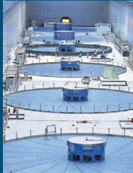
審計發現三峽地下電站個別開置及退場設備物資處置不規範, 導致增加投資1,965.51萬元。部分開置及退場物資設備處置不規範, 以低於規定價格42.53萬元處置物料集裝箱, 二是有200多項退場設備儀器未納入評估清單, 部分直接無償處置造成國有資產流失。

香港文匯報訊(記者孟慶舒 北京報道) 審計署昨日公佈對長江三峽水利樞紐工程地下電站竣工財務決算草案審計結果, 發現竣工財務決算草案多計投資約3.38億元(人民幣, 下同), 工程存在虛計工程量、多計費用等問題。此外, 設備物資採購、工程施工、技術諮詢服務等未依法依規招標, 涉及合同金額15.43億元。審計署稱目前三峽集團公司正在組織整改, 具體整改情況將由三峽集團公司向社會公告。