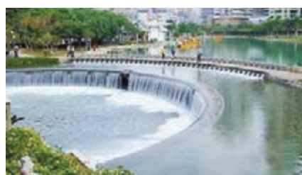
西北某些相對缺水的縣區不顧缺水的狀況大建人造水景。

再其次是生態折騰。一些地方在生態文明旗號下, 今天植草坪, 明天改花園, 後天栽大樹。這種生態折騰不但沒有產生任何價值, 而且成本巨大, 顯然與生態文明建設的初衷背道而馳。專家們呼籲, 中國生態城市建設需警惕「偽生態」。