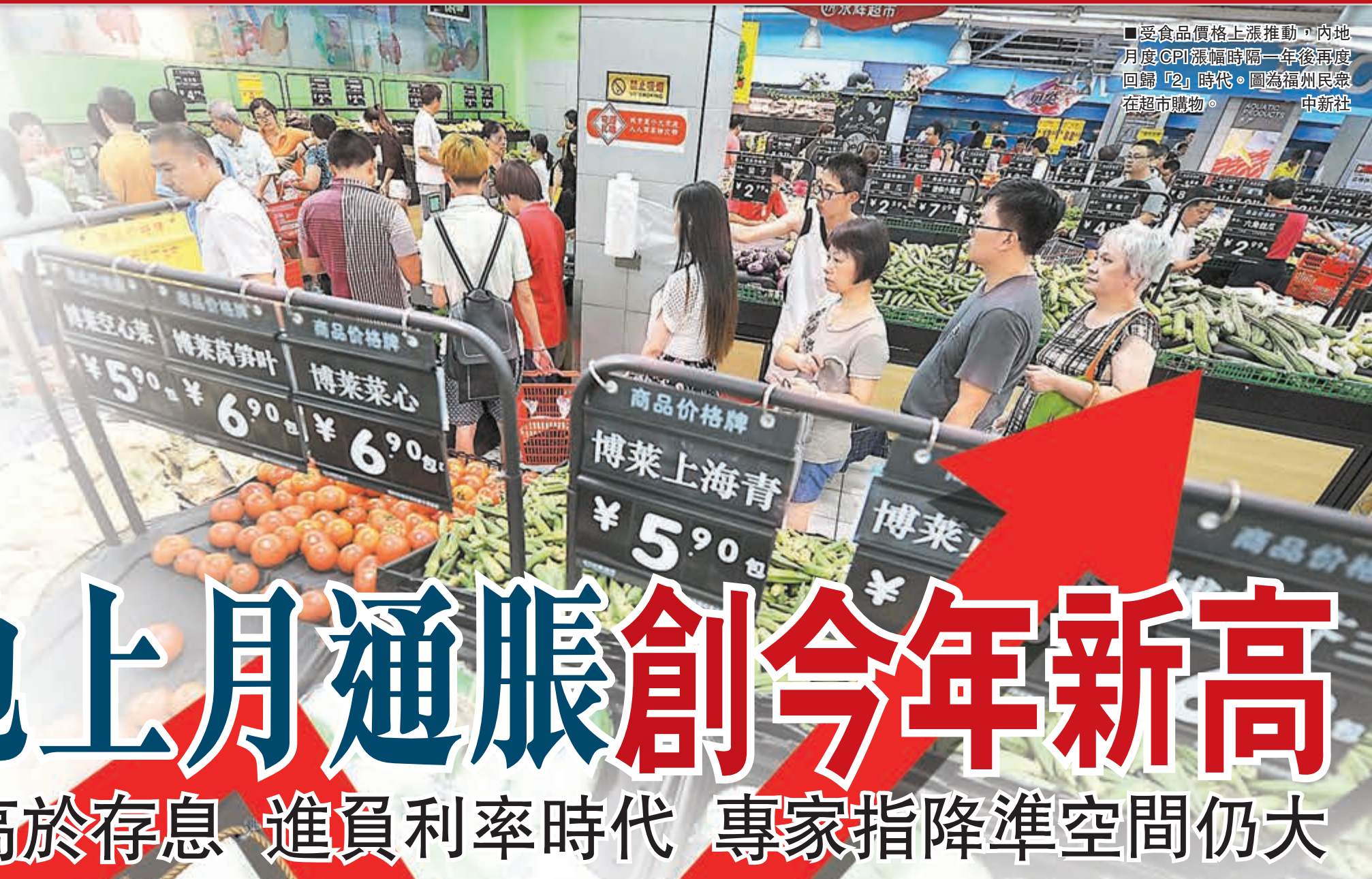
受食品價格上漲推動, 內地月度CPI漲幅時隔一年後再度回歸「2」時代。圖為福州民眾在超市購物。

香港文匯報訊(記者海巖 北京報道) 國家統計局昨日發佈最新數據顯示, 主要受豬肉、蛋等食品價格大幅上漲的影響, 8月內地居民消費價格(CPI) 同比上漲2%, 創今年以來新高。值得注意的是, 作為通脹衡量標準的CPI 同比漲幅, 超過了1.75%的一年期存款基準利率水平, 與銀行實際執行的2%左右的一年期存款利率基本持平, 隨著未來幾月CPI 漲幅可能繼續上升, 內地又一次進入實際「負利率」時代。