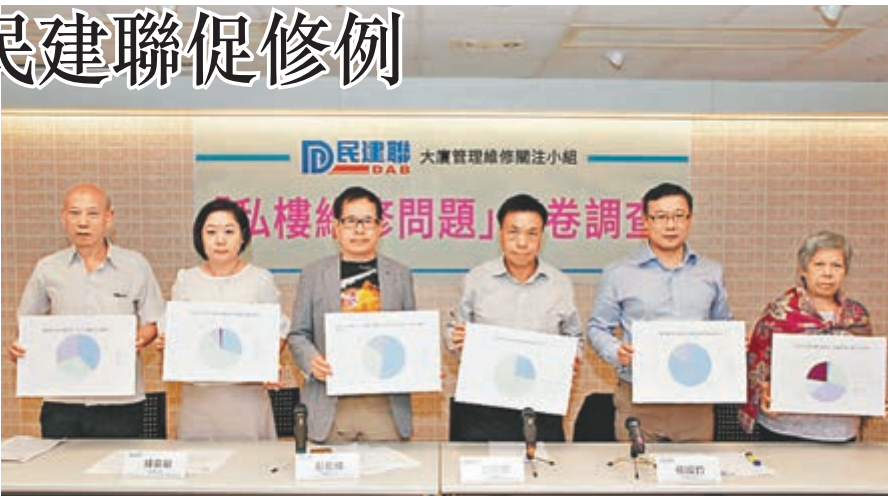
民建聯大廈管理維修關注小組認為,《競爭條例》未落實,純粹圍標並不違法,圍標問題自然愈來愈嚴重。

民建聯認為當局實施「強制驗樓」並推出資助計劃,令維修市場猶如「肥豬肉」,吸引不法分子透過圍標瓜分,但政府對工程圍標問題卻支援不足;加上維修費用的透明度不足,業主難以掌握合理價格,建議政府成立資料庫,讓業主推算基本維修工程費用。對於不少受訪者指即使懷疑工程涉圍標,但大多未有向執法單位求助,民建聯批評有法律漏洞,指《競爭條例》未落實,圍標過程不涉及行賄、受賄或刑事成分的話,純粹圍標並不違法,令小業主投訴無門。小組建議當局降低工程估價服務的門