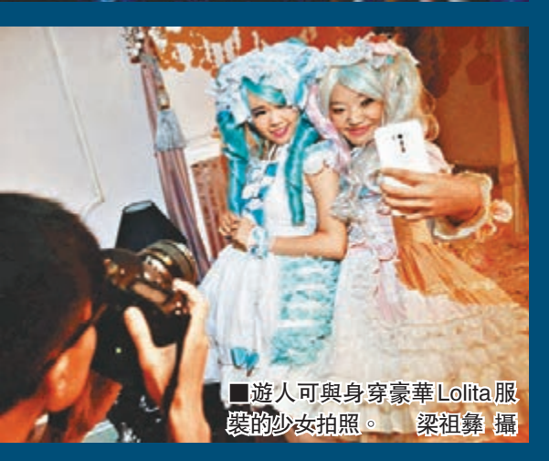
遊人可與身穿豪華 Lolita 服裝的少女拍照。