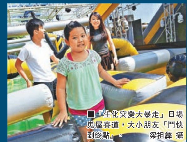
「生化突變大暴走」日場鬼屋賽道,大小朋友「鬥快到終點」。