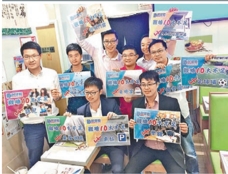
民建聯觀塘區青年團隊促請政府善用空置土地,在觀塘區增建地區設施。

香港文匯報訊(記者 李自明)民建聯一向注重地區工作。為更好解決地區問題,民建聯觀塘區青年團隊昨日與傳媒茶敘,羅列觀塘區的「十大不足」,包括學位供應不足、私人樓宇供應不足等等,促請特區政府善用空置土地完善地區設施,及早應對觀塘區的人口急升。放眼年底的區議會選情,他們坦言,參選名單至今仍未「拍板」,但團隊正扎根服務13個選區。他們又說,雖然未知由「傘兵」組成的「東九龍社區關注組」狙擊目標「花落誰家」,但認為更多青年參政是好事。