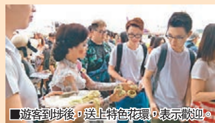
遊客到埠後，送上特色花環，表示歡迎。