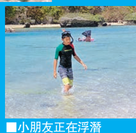
小朋友在觀賞魚兒