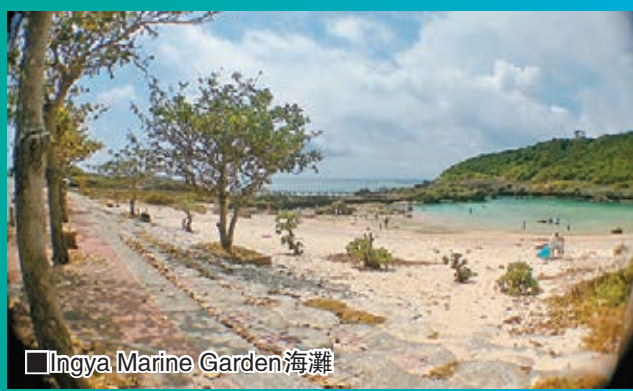
Ingya Marine Garden海灘

遊畢東平安名崎後，大夥兒來到Ingya Marine Garden海灘，這兒地處海水深度較淺，是潛水初學者喜愛的天然海灘。以潛水及各項水上活動而聞名的宮古島，海水清澈，擁有大片甘蔗的耕地。島嶼是由珊瑚礁形成後，隨地殼運動隆起而成，所以全島呈平坦的高地狀，地勢較低，地理環境獨特。筆者看着當地小朋友在浮潛、觀魚，雙腳在水裡漫步，感到極舒服。