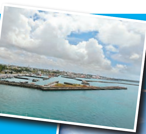
從郵輪上，欣賞宮古島的風光。