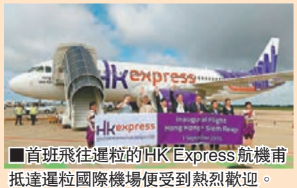
首班飛往暹粒的HK Express航機甫抵達暹粒國際機場便受到熱烈歡迎。