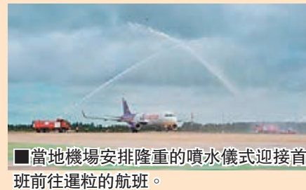
當地機場安排隆重的噴水儀式迎接首班前往暹粒的航班。

感受到當地人的熱情。暹粒是亞洲其中一個最受歡迎的旅遊城市，由文化據點吳哥窟寺廟遺址至充滿特色的傳統市集，令不少追求傳統文化風光之旅的香港旅客均慕名而至，加上富有殖民地色彩的獨特建築物和多元化的亞洲美食，暹粒實在是充滿着各種旅遊瑰寶的熱點。由即日起，每周二、四及日提供往返香港和暹粒的航班，成為唯一一家開通香港—暹粒直飛航線的低成本航空公司。