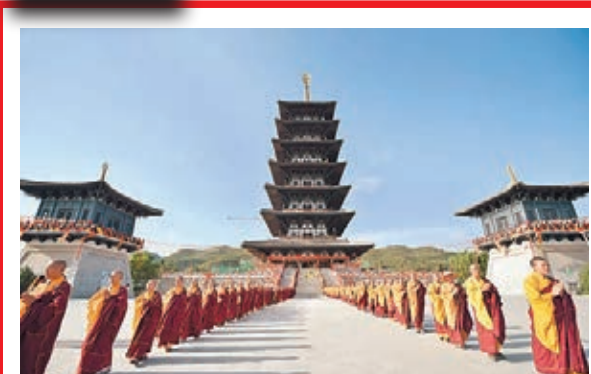
甘肅佛教界舉行祈禱世界和平祈福法會 僧眾在涇川縣大雲寺舉行的祈禱世界和平祈福法會上。