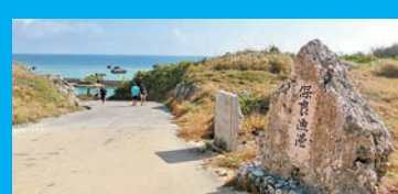
在東平安名崎旁，有個保良魚港，環境優美。