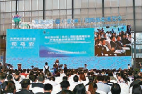
貴陽「酒博會」開幕現場。

香港文匯報訊(記者 徐悅 貴陽報導)第五屆中國(貴州)國際酒類博覽會9日在貴陽開幕，並將持續至12日。當天，超過2萬名國內外專業採購商雲集貴