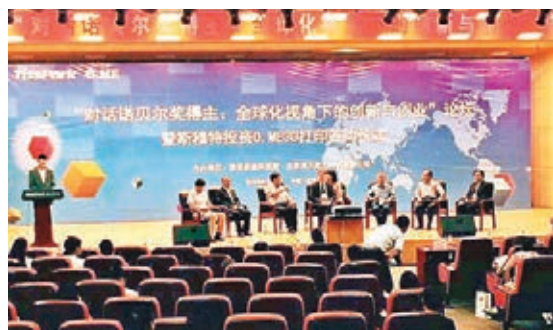
清華科技園孵化的3D打印機智能應用及創意教育開發企業OME簽約活動現場。

香港文匯報訊(記者 吳昊、實習記者 任芳瑛 北京報導)中國以巨大的市場潛力一直吸引着眾多海外創業者投資，隨着中國政府全方位佈局「雙