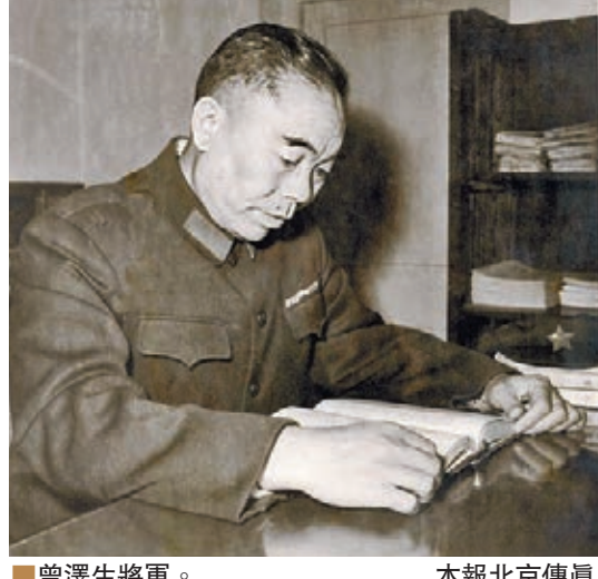
曾澤生將軍。

香港文匯報·人民政協專刊訊（記者 張紫晨、王曉雪、凱雷 北京報道）9月3日，凝聚着全中國人民70年心願與心血的勝利日大閱兵終於在全世界的矚目下完美面世。著名抗日將領、解放軍中將曾澤生孫女曾學鋒女士在接受本刊獨家專訪時表示，大閱兵告慰了那些在抗戰中為國捐軀英烈們的在天之靈，她的祖父曾澤生抗日期間率領滇軍赴台兒莊抗戰，滇軍在戰場上奮勇殺敵，令日寇膽寒。「無論處在什麼環境和立場，祖父一直發揚黃埔精神，從未改變忠義愛國的初衷，為國家和人民奉獻了自己的一生。」曾澤生將軍祖籍四川，1902年出生於雲南昭通永善縣，是雲南講武學堂十八期學員。1924年12月入黃埔軍校三期，在校期間擔任區隊長，1926年1月畢業。1927年再次進入黃埔軍校高級班軍事科學習，1928年畢業。