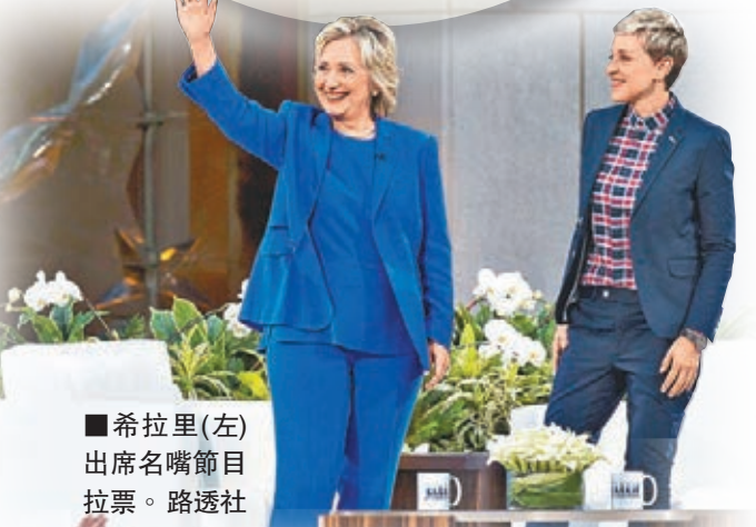
希拉里(左)出席名嘴節目拉票。