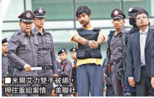
米爾艾力雙手被綁，押往重組案情。

爆炸案造成20死130傷，嚴重打擊泰國旅遊業，流失旅客人數估計多達133萬，業界損失約