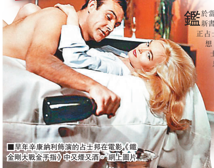
早年辛康納利飾演的占士邦在電影《鐵金剛大戰金手指》中又煙又酒。