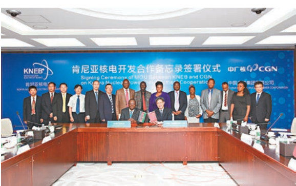
中廣核與肯尼亞核電局簽署核電開發合作備忘錄。

香港文匯報訊(記者 羅珍 深圳報導) 中國廣核集團日前與肯尼亞能源與石油部下屬的核電局在大亞灣核電基地正式簽署了《中國廣核集團有限公司與肯尼亞核電局關於肯尼亞核電開發合作的諒解備忘錄》。根據諒解備忘錄，中廣核與肯尼亞核電局雙方將基於華龍一號(HPR1000)技術及其改進技術，在肯尼亞核電開發和能力建設方面開展全面合作，包括研發、建設、運營、燃料供應、核安全、核安保、核廢物管理和退役等領域。