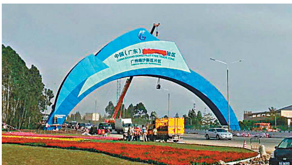
粵保監會提10條措施支持南沙自貿區。

另外，在粵港澳服務貿易自由化協議框架下，將爭取降低港澳保險機構在自貿區設立營業性機構的門檻，推動粵港澳保險機構在自貿區協同為跨境流動的居民提供保險服務。