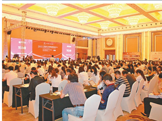
由中國房地產業協會等主辦的中國房企品牌價值測評在重慶發佈排行榜。

香港文匯報訊 昨天在重慶舉行的「2015中國房地產企業品牌價值測評成果發佈暨房地產品牌發展高峰論壇」上，揭曉了2015年內房品牌測評結果，中海、恒大、萬科分別以362.16億元(人民幣，下同)、320.67億元和307.15億元的品牌價值排行前三甲。從近兩年中國房地產品牌價值20強榜單來看，2014年至2015年連續兩次入選20強的企業共有18家，換榜率為10%。榜單前四位連續兩年皆由中海、恒大、萬科、保利包攬，10強其餘席位則主要由富力、綠地、龍湖、世茂等企業佔據。華夏幸福、遠洋地產、華潤、金融街以及陽光城憑借突出的業績表現和品牌塑造，排名均較2014年有所上升。