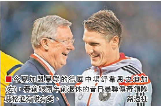
今夏加盟曼聯的德國中場舒拿恩史迪加(右)，賽前跟兩年前退休的昔日曼聯傳奇領隊費格遜有說有笑。

今場梅拿延續其聯賽的佳態，貢獻兩個「士哥」和一次助攻，他當然對賽果非常滿意：「我的感覺很好，皮球剛好落在適當位置，我亦作出正確的判斷。」根度簡指拍檔助攻太靚，要入球