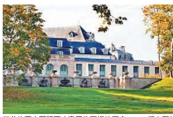
英格蘭大軍明夏決賽周將下榻的酒店。

英格蘭國家隊已提前鎖定明夏歐洲國家盃決賽周入場券，英國傳媒報道，「三獅」大軍選定在法國爭