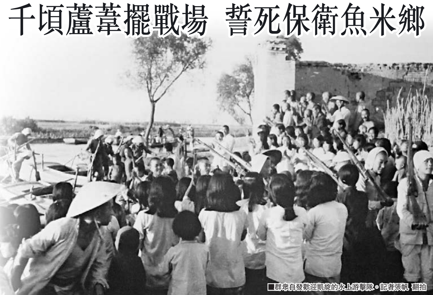
群眾自發歡迎歡迎航運的水上游擊隊。

「一九四三年，環境大改變，白洋淀的崗樓端了多半邊……」這首民歌反映的是1943年以後，白洋淀對敵鬥爭形勢有了很大改變。到1945年，英雄的白洋淀軍民配合主力部隊全線出擊，解放新安城，徹底摧垮了盤踞新安的敵人。時隔不久，抗戰取得了最後勝利。