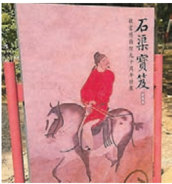
■「石渠寶笈特展」開幕。