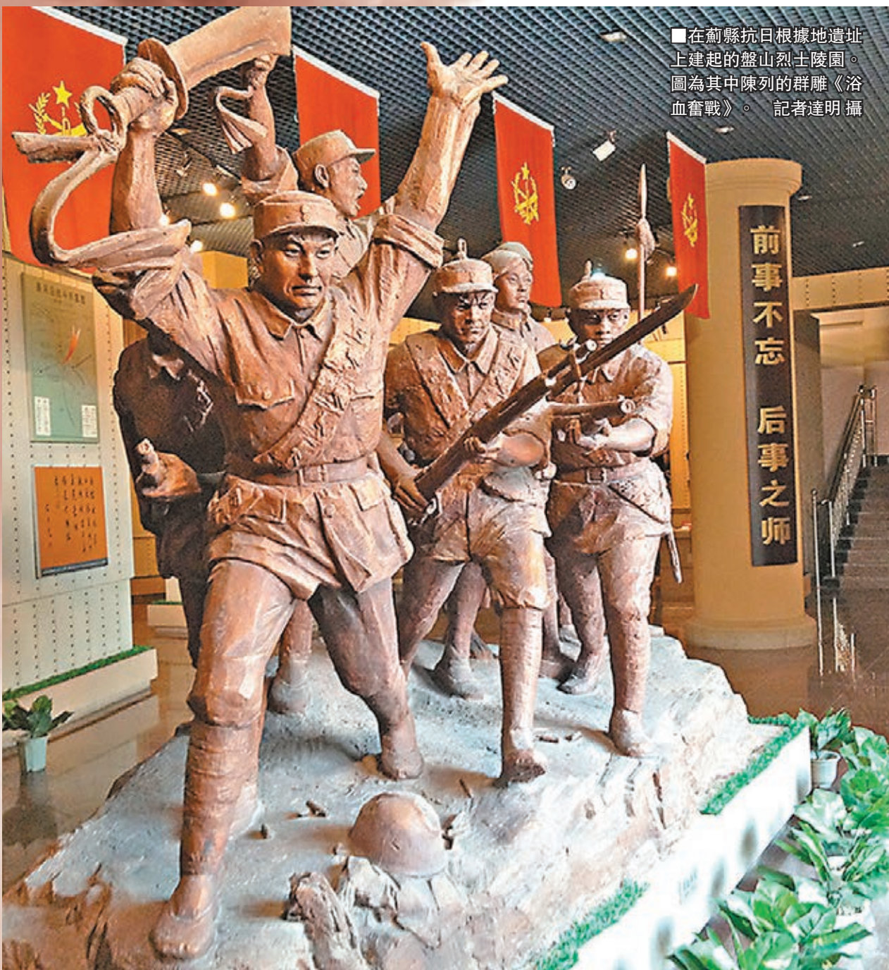
在薊縣抗日根據地遺址上建起的盤山烈士陵園。圖為其中陳列的群雕《浴血奮戰》。記者達明攝