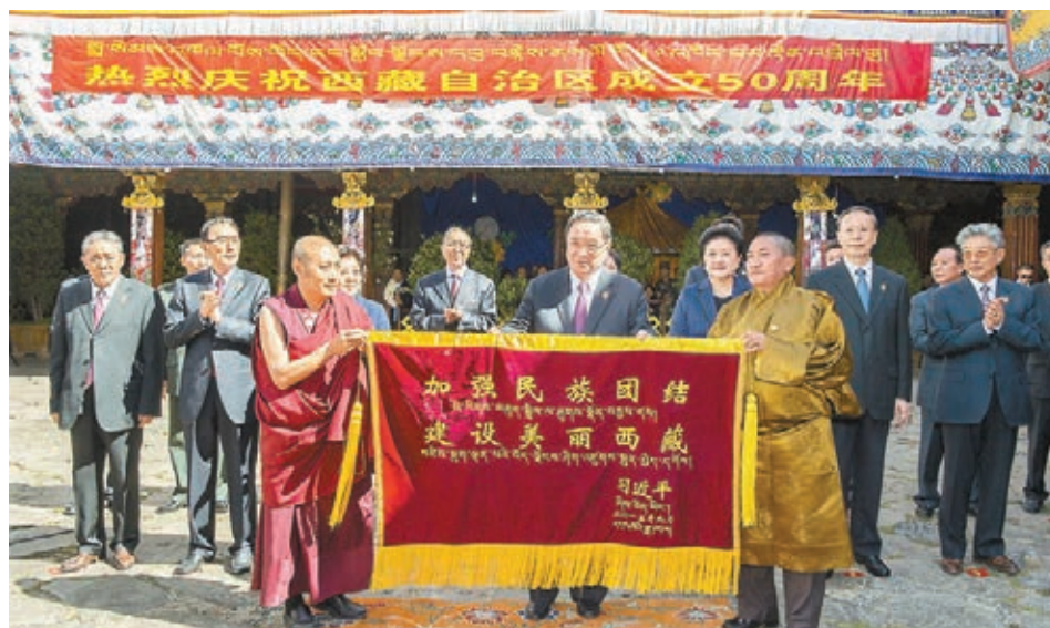
俞正聲向大昭寺贈送習近平總書記親筆題寫的「加強民族團結 建設美麗西藏」賀幛。

香港文匯報訊 據中新社報道，正在拉薩出席西藏自治區成立50周年慶祝活動的中共中央政治局常委、全國政協主席、中央代表團團長俞正聲，昨日上午來到大昭寺，看望慰問西藏宗教界愛國人士。約100名大昭寺僧人在正門兩側列隊，以隆重禮儀歡迎中央代表團的到來，他們點燃藏香，吹響法號，並向貴客敬獻潔白的哈達。俞正聲向大昭寺贈送了習近平總書記親筆題寫的「加強民族團結 建設美麗西藏」賀幛、琺瑯彩平安瓶，並向僧人發給佈施。