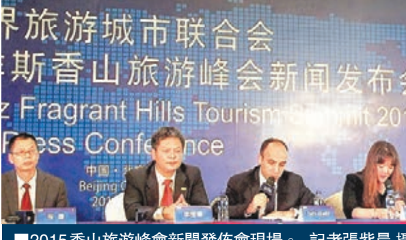
2015香山旅遊峰會新聞發佈會現場。