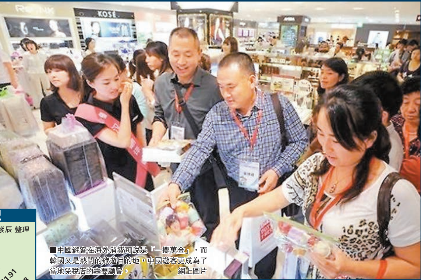
中國遊客在海外消費可說是「一擲萬金」，而韓國又是熱門的旅遊目的地，中國遊客更成為了當地免稅店的主要顧客。

香港文匯報訊（記者張紫晨、羅洪嘯及中新社綜合報道）世界旅遊城市聯合會昨日在北京發佈《2015年度中國公民出境（城市）旅遊消費市場調查報告》。在國際旅遊收入中，平均每9美元的消費，就有1美元出自中國遊客的腰包。2014年，中國出境旅遊人數在國際遊客中的比重達到9.58%，出境旅遊消費在國際旅遊收入中的比重達到11%。中國出境旅遊消費總額達到1,650億美元，同比增長28%。僅海外旅遊購物一項人均花費就高達10,130元（人民幣，下同），其中59.53%的受訪者表示會購買紀念品，51.28%會購買化妝品，40.37%會購買奢侈品，且中國人海外購物喜歡比較價格，購物的主要動因是價格在當地更超值。