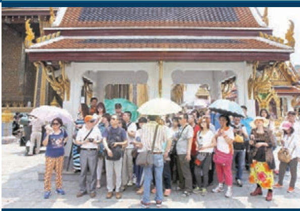
曼谷是中國遊客東南亞首選目的地。

本次調查顯示，「互聯網+」對出境旅遊的影響日益明顯。67%以上的遊客通過互聯網預定酒店機票、搜索旅遊攻略、查詢旅遊目的地信息和購買門票。