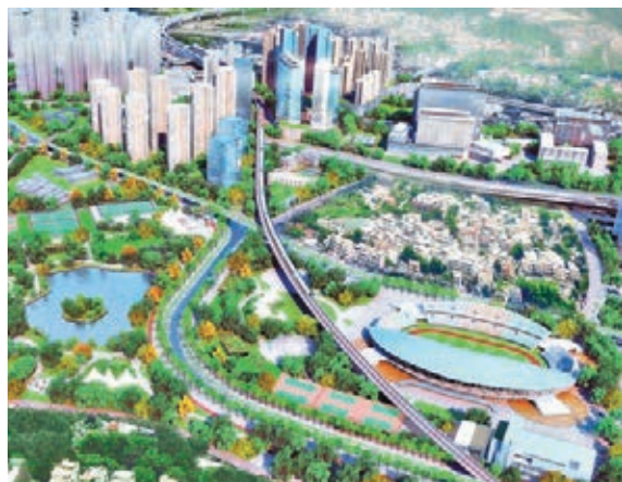
當局指出，物流業界普遍支持洪水橋新發展區，認為可享地理與勞動力的優勢。

另外，對於尖沙咀海濱重建計劃獲城規會有條件通過後，康文署決定展開公眾諮詢，暫不與新世界發展簽署管理委託協議。凌嘉勤重申，星光大道是整個海濱活化計劃中很重要的一環，但諮詢內容主要是如何管理及操作，有關方面無須由城規會審批。