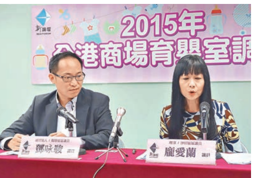
新世紀論壇的調查發現，朗豪坊、時代廣場及太古廣場的育嬰室均沒有獨立哺乳室。

香港文匯報訊(記者 何寶儀)世界衛生組織建議，應以全母乳餵哺嬰兒至6個月大，但早前有調查指出，80%受訪母親認為香港的公共地方育嬰設施不足。有團體昨日公佈一項全港28間商場育嬰室的調查，發現整體設施得到提升，平均分較去年上升12.5分至75.1分，但太古廣場及海港城等部分商場仍存在一些不起眼的安全陷阱，嬰兒翻身時有機會從換片台掉下來，促請特區政府立法規管商場設有育嬰室。