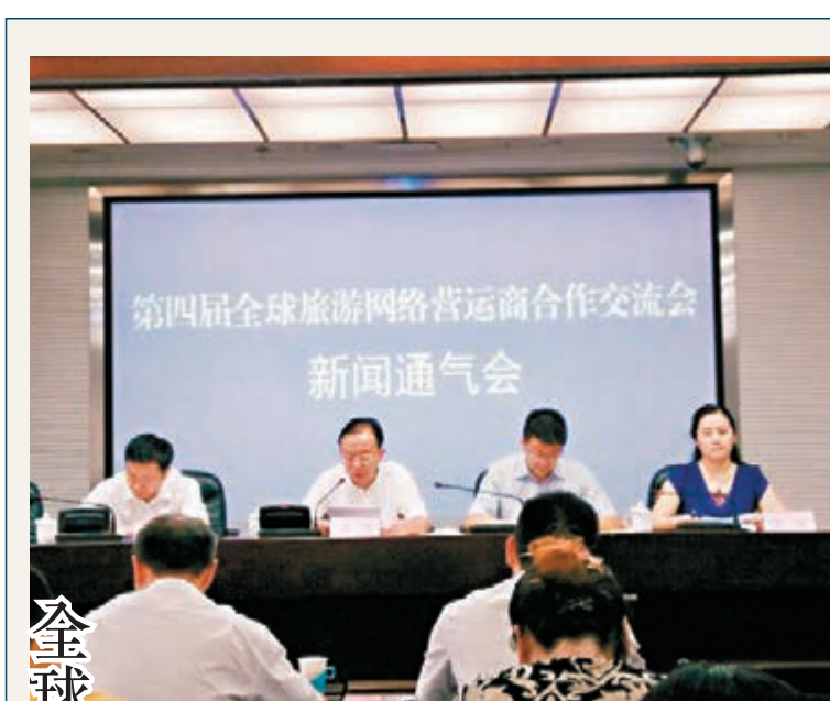
「第四屆全球旅遊網絡營運商合作交流會」新聞通氣會現場。

7月底,中鹽合肥化工基地二期暨30個重點項目集中開工儀式在合肥循環經濟園舉行,總投資達到204億元,單體項目平均投資規模6.8億元,其中工業項目20個,總投資121.1億元,預計建成達產後可實現年產值150.5億元,稅收10億元,帶動就業3,700人。此外,建立完善重點項目專題調度責任制,對90個重點工業項目由縣分管領導任主要責任人,每月深入項目點及時了解和摸排項目建設過程中存在的困難和問題,做好協調服務,當好「聯繫員」和「服務員」,幫助企業解決具體困難。