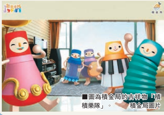
■圖為積金局的吉祥物「積積樂隊」。積金局圖片