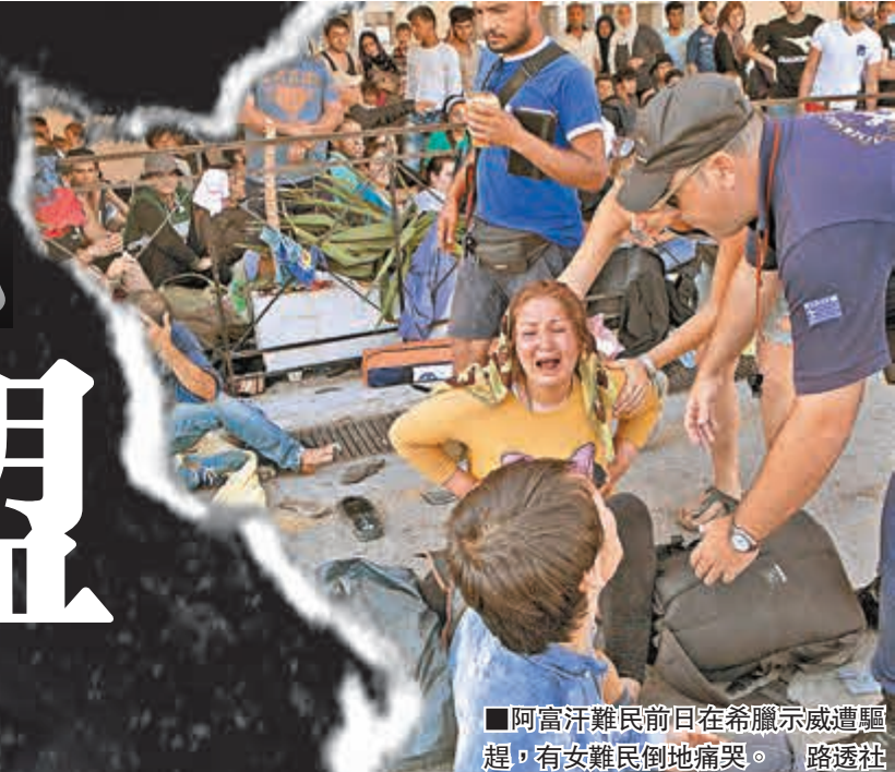
阿富汗難民前日在希臘示威遭驅趕，有女難民倒地痛哭。