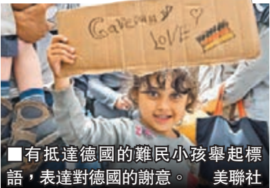
有抵達德國的難民小孩舉起標語，表達對德國的謝意。

運動，內政部指今年以來全國共發生336宗針對難民的暴力事件，較去年全年多出逾100宗，大部分是右翼支持者所為。