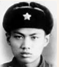
任志強退役後揚名商界。右為38軍當兵時的任志強。

香港文匯報訊(記者馬靜 北京報道)無論是轉業、復員還是自主擇業,不少軍官卸甲後依然保持軍人本色,其中更不乏表現突出的優秀典型。