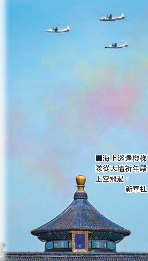
海上巡邏機梯隊從天壇祈年殿上空飛過。

運八警戒機體形上比空警200H、運八技術偵察機略小一圈,是中國第一代遂行偵察監視和巡邏警戒等任務的專業機型,主要針對海上目標,可承擔偵察監視、巡邏警戒、指揮引導以及引導搜救等任務。