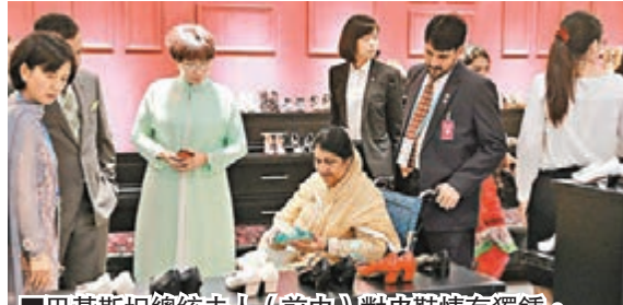
巴基斯坦總統夫人(前中)對皮鞋情有獨鍾。