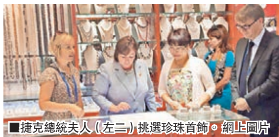
捷克總統夫人(左二)挑選珍珠首飾。