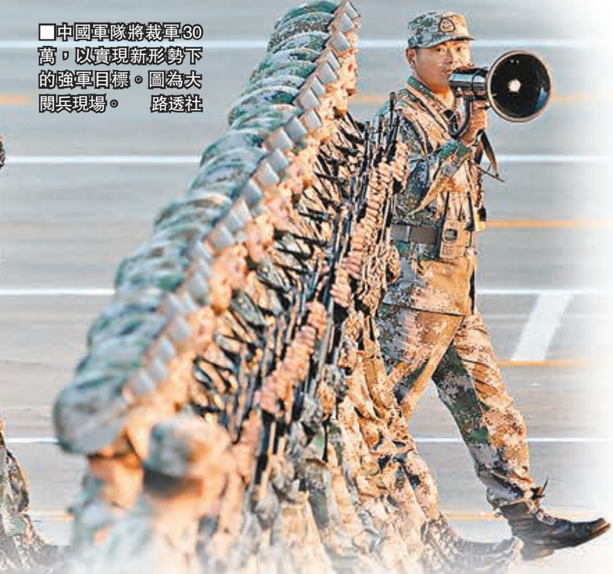
中國軍隊將裁軍30萬,以實現新形勢下的強軍目標。圖為大閱兵現場。