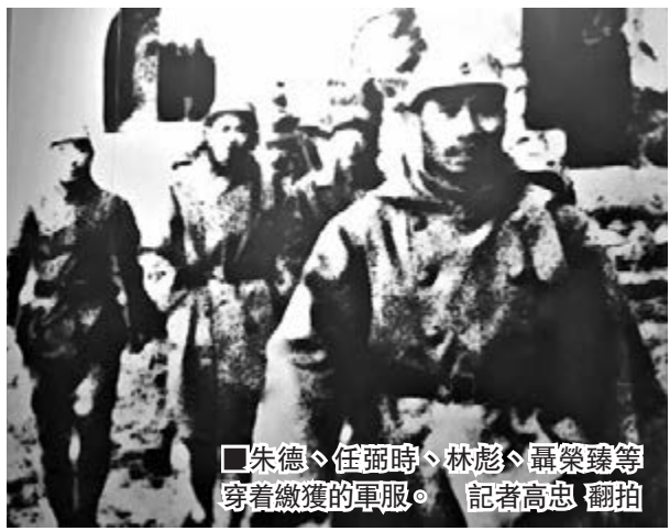
■朱德、任弼時、林彪、聶榮臻等穿着繳獲的軍服。

「殲滅日軍1,000餘人，擊毀日軍汽車100餘輛、馬車200餘輛，繳獲日軍步槍1,000餘支、九二式步兵炮1門、炮彈2,000餘發、機槍20餘挺……」在平型關大捷紀念館內，一段文字這樣描述着平型關大捷的戰果。玻璃櫥窗內，擺放着的步槍、機槍、炮彈、望遠鏡、日式軍刀也默