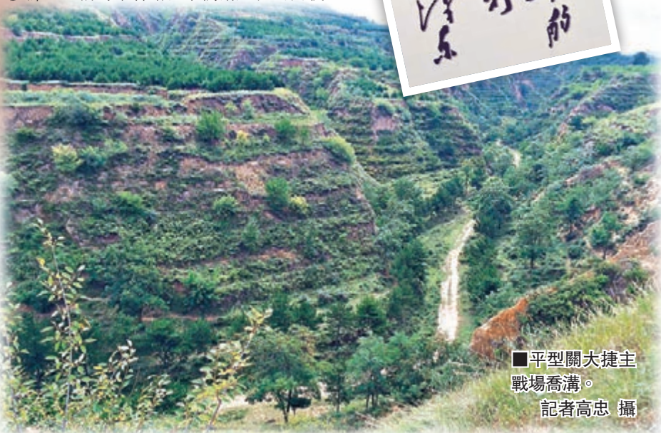
■平型關大捷主戰場喬溝。